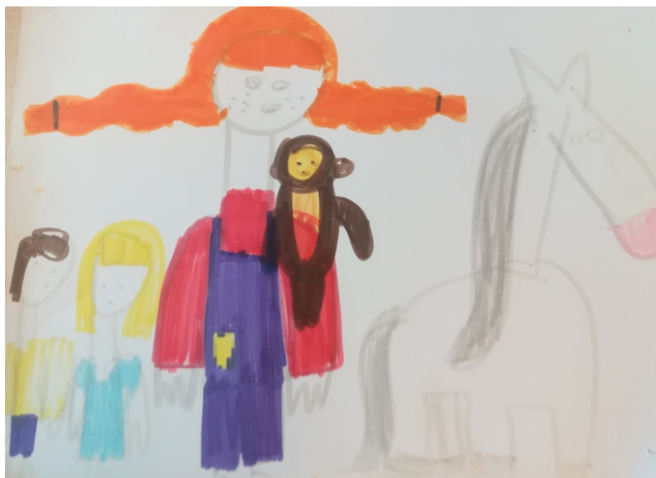
Pika Nogavička