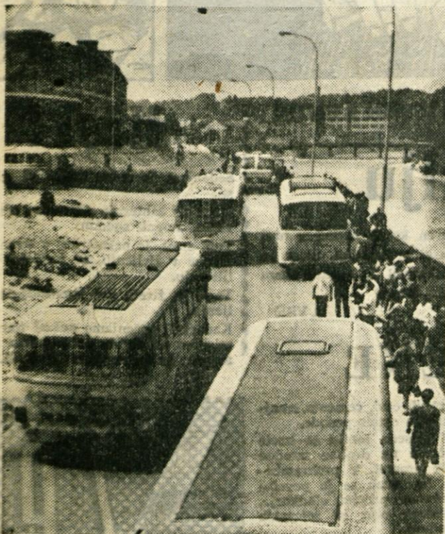
Kranjske ceste so vse bolj ozko grlo. Zlasti ob tako imenovanih prometnih konicah, katerim se v sedanjem času pridruži še ves mednarodni tranzit skozi Gorenjsko. Prizor iz ceste pri Savskem mostu