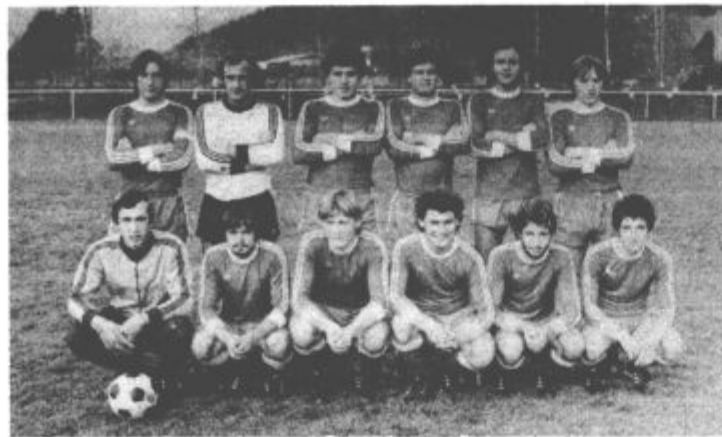
Nogometaši selekcije iz Šmartnega ob Paki