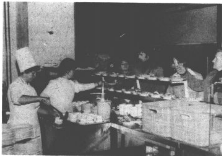
Ugoditi je treba različnim željam