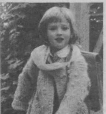
Ko otrok postane šolar, vstopi v nov zanimiv svet, ki je poln nevarnosti.

Tudi v letošnjem šolskem letu so potekale aktivnosti, katerih namen je zagotoviti varnost otrok na poteh v okolici šole. Koordinator jih je Občinski svet za preventivo in vzgojo v cestnem prometu oziroma njegova Komisija za vzgojo in izobraževanje v cestnem prometu. Osnovne šole je pozvala, da aktivnosti izvedejo. Pred začetkom šolskega leta je treba obnoviti prometno varnostne načrte osnovnih šol, izdelati programe prometne vzgoje za tekoče šolsko leto in druge aktivnosti po programu šole že v prvih dneh pouka pa aktivirati učence prometnike, seznaniti starše s prometno varnostnim načrtom osnovne šole, seznaniti otroke z var-