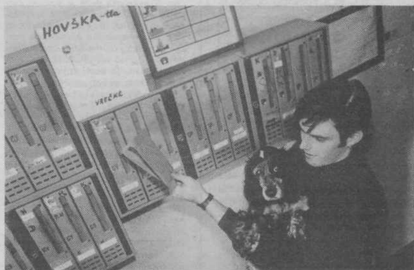
Leseni zabojčki, veliki kot poštni nabiralnik, bodo kmalu v blokih, kjer imajo večje število štirinožnih živali. V KS Moste-Selo so zabojčkom dali ime »HOVŠKA«, kar je skovanka iz besede, ki označuje pasji lajež in iz prvega dela besede škatla. V »HOVŠKAH« bodo čakale vrečke tiste ljubitelje živali, ki imajo poleg živali radi tudi čisto in lepo okolje.

Zanimiv je tudi POSTOPEK Z NEREGISTRIRANIMI PSI IN DRUGI PREVENTIVNI UKREPI