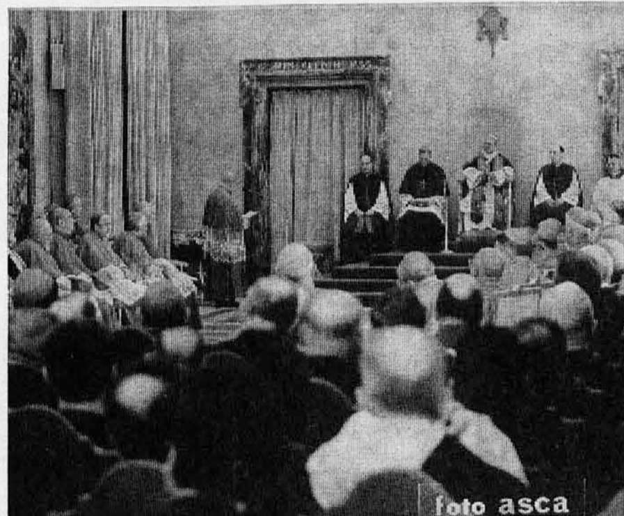
Sv. oče Pavel VI. govori kardinalom rimske kurije ob srečanju za božične praznike, med katerim so mu kardinali izrekli svoja voščila