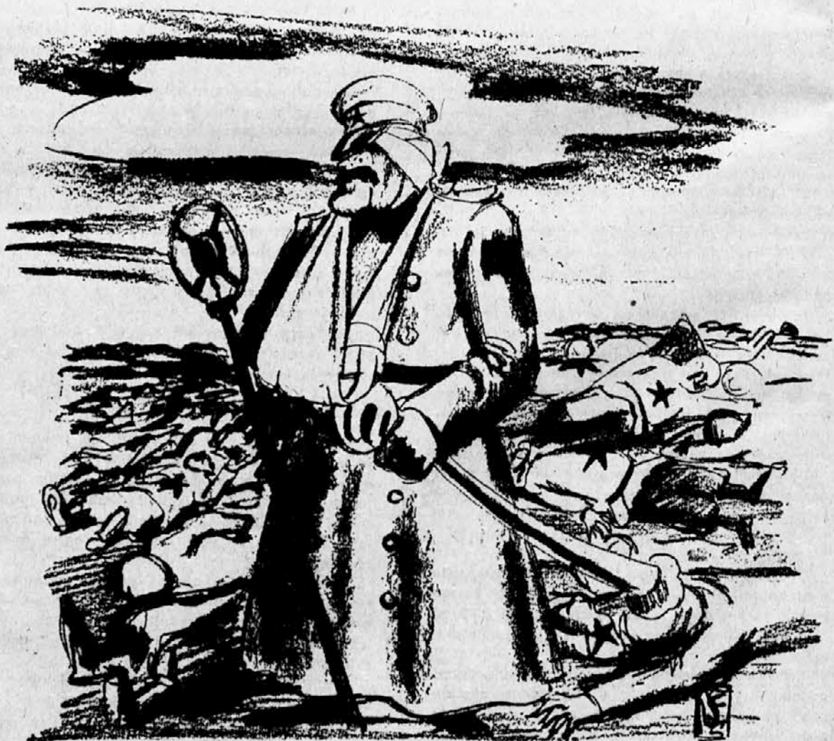
Radjo Moskva: Naše čete so dosegle cilj, ki nam ga je deležil Stalin. - Samo eden ranjen.

Niso več časi prve svetovne vojne, ko so Amerikanci lepo doma počivali in so le ob koncu vojne poslali v nekatera evropska mesta, ki so bila izven konflikta nekaj rezervnih čet. Danes so tudi oni primorani spoznati vse neprijetnosti in žrtve, ki jih prinaša vojna.