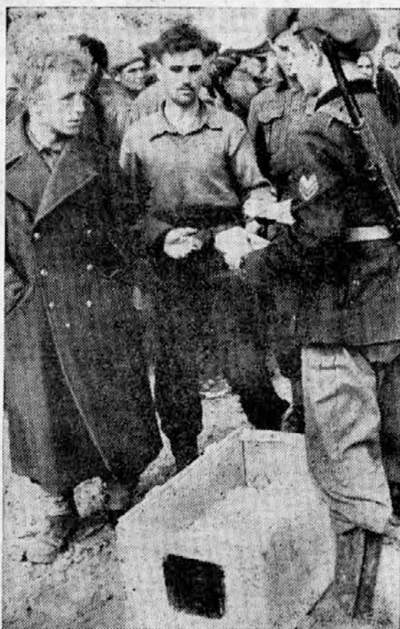
Razdelitev živeža angleškim ujetnikom.

Naše edinice v spremstvu konvoja, ki je plul v Sredozemlju, so zavržile napadalne poskuse bri-