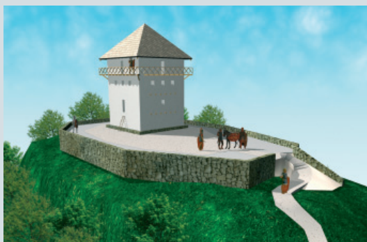
Morebiten prvotni izgled obrambnega stolpa.

xxxx – obrambno nadzorni stolp, ki naj bi skupaj z gradiščem Puštal nad Trnjem nadziral prehod v Selško dolino. Morda celo del obrambne linije, ki je potekala na zahodnem obrobju Sorškega polja.