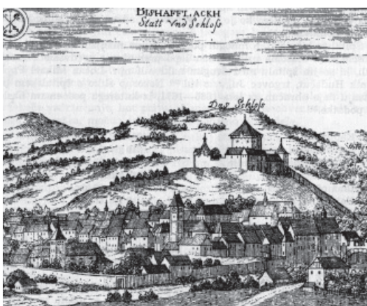
Bakrorez Škofje Loke izdelan po predlogi iz skicne knjige J. V. Valvasorja iz leta 1679. Na tej upodobitvi je na desni strani tudi ruševina gradu DivjaLoka.