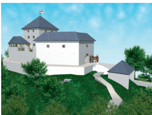
Morebiten izgled po utrditvi v 14. stoletju.