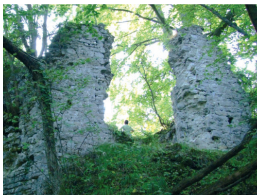
Fotografija današnjega stanja ruševine.

2006 - fotografija današnjega stanja gradu.