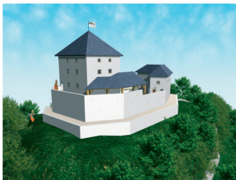
Računalniška upodobitev gradu DivjaLoka.