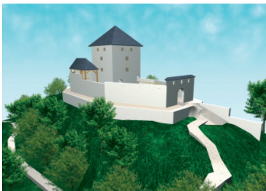
Morebiten izgled v 13. stoletju.

1649 – na upodobitvi Škofje Loke Matevža Meriana so lepo vidni nekateri podobni gradovi na obrobju Sorškega polja. DivjaLoka ni viden, ker je skica narejena iz Kranjla.