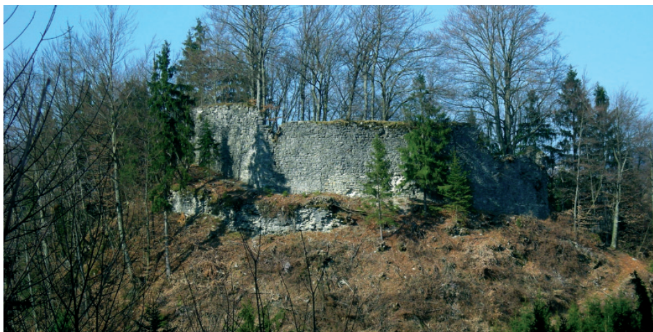
Fotografija današnjega stanja ruševine.

Dokaj dobro sta ohranjena zunanje in notranje obzidje. Vidni so še določeni detajli, odtoki, utori za lesne konstrukcije in odprtini za vhodno preklado. Poleg tega v tlorisu lahko zasledimo najmanj dve osnovi zgradb. Ena je tik ob vhodu desno in druga, večja v ozadju, ki verjetno predstavlja ruševine bivalnega stolpa. Z malo truda bi verjetno naleteli na še bolj natančno zasnovano in razporeditev objektov. Vidni so tudi ostanki zidu, ki poteka proti S, izven obeh obzidij.