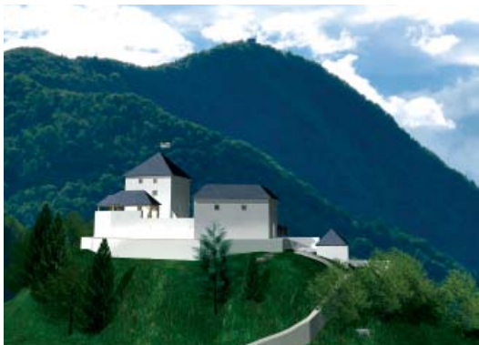
Računalniška upodobitev možne obnove oziroma zaščite gradu.