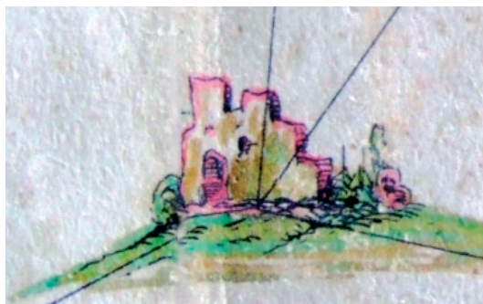
Skica v franciscejskem katastru iz leta 1869.

1678 - iz tega leta izhajata dve upodobitvi gradu Wildenlack, ki sta delo Janeza Vajkarda Valvasorja. To sta skici Škofje Loke in Stare Loke, na katerih je vidna tudi ruševina gradu DivjaLoka; to sta tudi prvi znani upodobitvi tega gradu.