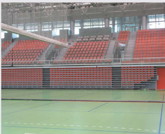
Športna dvorana Vitez, BiH