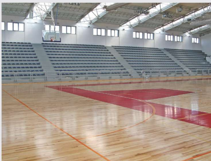
Športna dvorana v Zenici, BiH

Poleg teh dveh dvoran so opremili še dvorano v Smederevu (Srbija) in več manjših dvoran na Hrvaškem. V Sloveniji pa trenutno končujejo dvorane v Rogatcu, Škofji Loki, Vipavi, Voklem in Šmartnem pri Litiji.