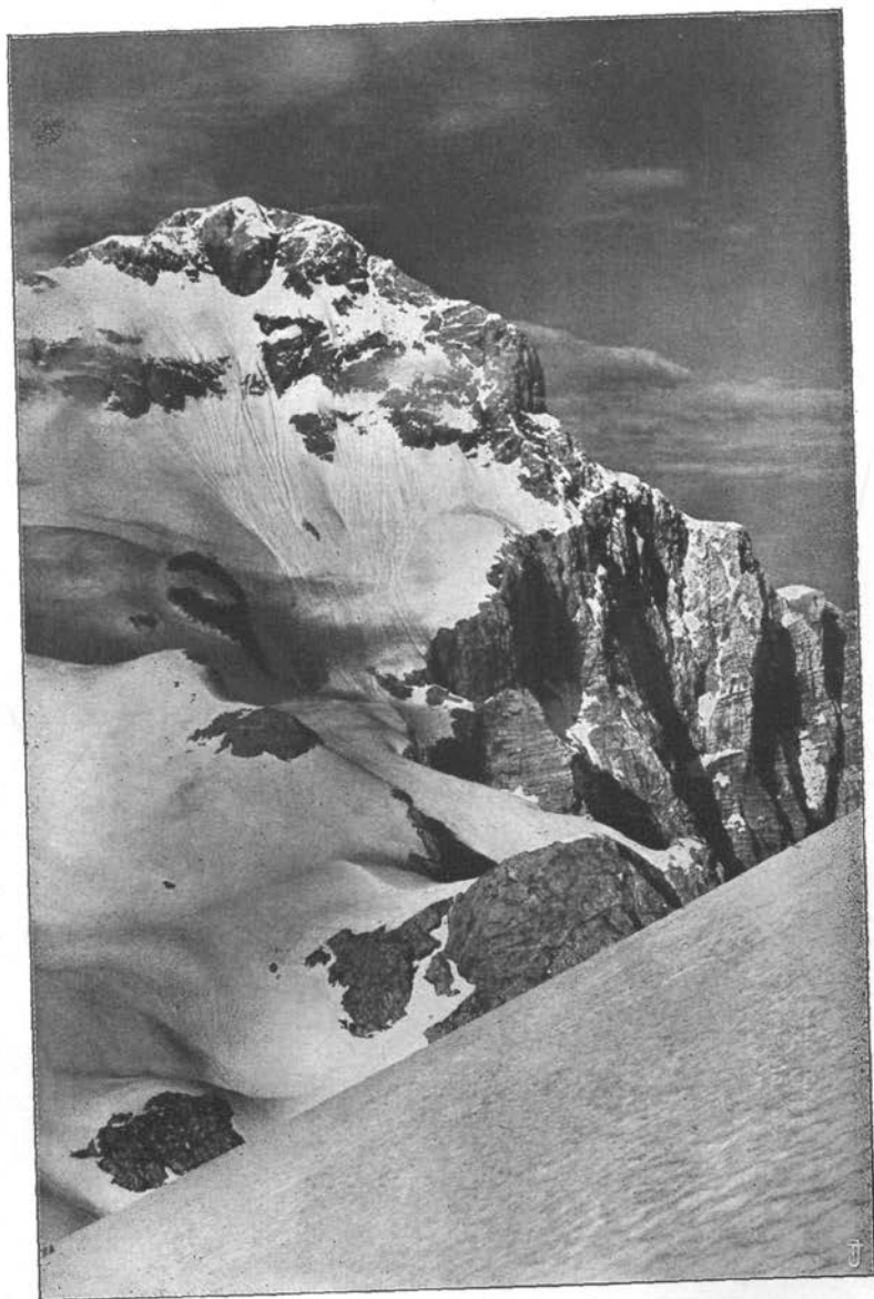
Triglav z Begunjskega vrha