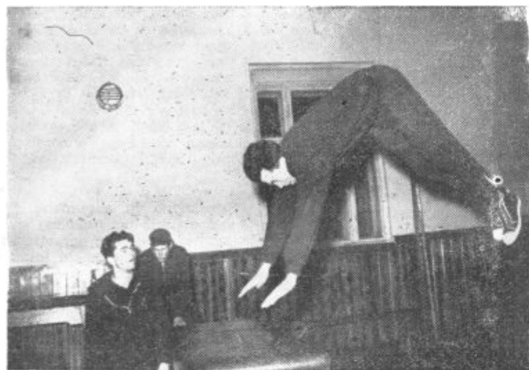
Drzen skok in elegantna drža to je odlika telovadca na sliki. Sicer pa so v teh zimskih dnevih podobni prizori na dnevnem redu. Lenarški telovadci redno trenirajo in se pripravljajo na nove nastope

Lenarški Partizan je v preteklem letu dosegel izredno lepe uspehe o katerih je potrebno večkrat javno spregovoriti. Menimo, da je prav časopis sredstvo preko katerega se lahko najširši krog lju-