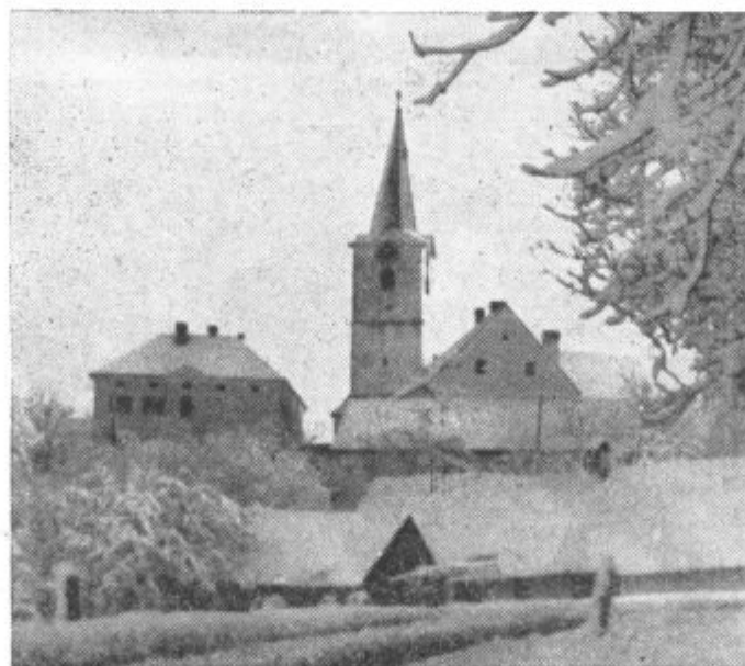
Zimski motiv iz Cerkevnik.

Po vesteh TASS je napredna javnost v Kongu čedalje bolj vznemirjena zaradi negotove usode podpredsednika kongoške vlade Gizenge. V javnosti se porajajo mnenja, da je bila aretacija Gizenge nezakonito dejanje.