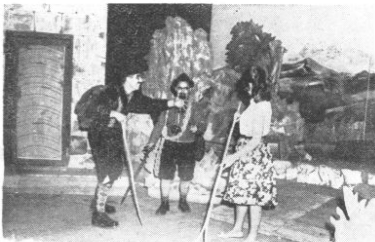
Po daljšem presledku so v Cerkvenjaku uprizorili igro »Dekle s Trente«. Na sliki: prizor s krstne uprizoritve.