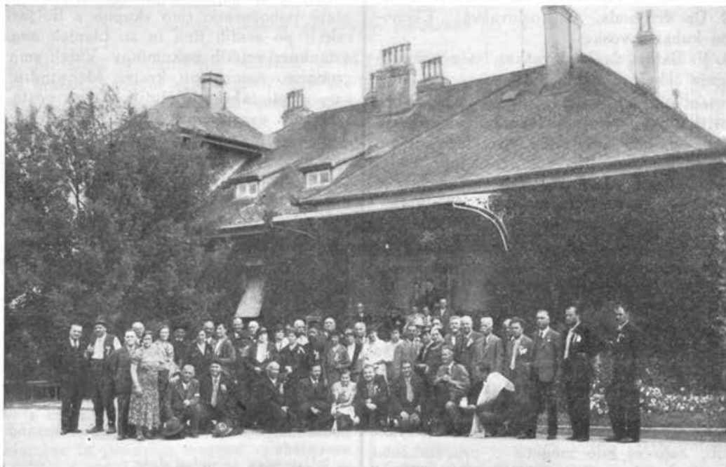
Pred kraljevim dvorcem na Oplencu ob Vseslovanskem čebelarstvu kongresu v Beogradu