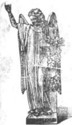
Brzojavl: „Kamnoseška industrijska družba Celje“.