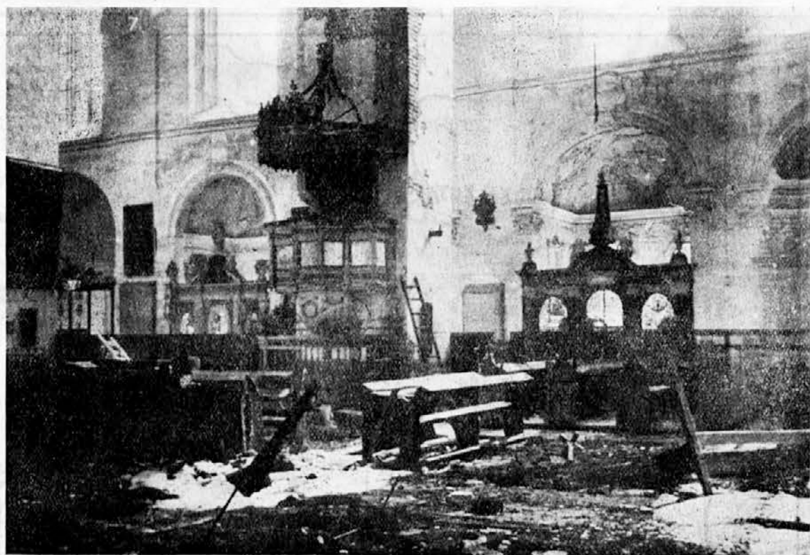
Kako spoštujejo Angleži cerkve.

Španška in Portugalska sta sklenili pakt o medsebojni pomoči v slučaju sovražnikovega izkrcanja na njih zemlji in v njih kolonijah. Amerika in Anglija sta protestirali. Zgleda, da sta imela namen zasesti jim kak del njih nevtralne zemlje, da bi vsaj na tak način dosegli kako zmago. Tudi ti dve državi sta opazili in razumeli, kdo je njih sovražnik, ki išče, da bi uničil njih svobodo v imenu neke lažne svobode, nasprotno zgodovini in veri in zato sta ustopili v novi tir evropskih idej. Če Amerika in Anglija ne bosta menjali delovanja in postovanja bosta se znašli prav gotovo kot nasprotnika tudi ti dve državi, ki bosta vstali proti sovražnikom svoje zemlje in proti židovskim zatiralcem Boga.