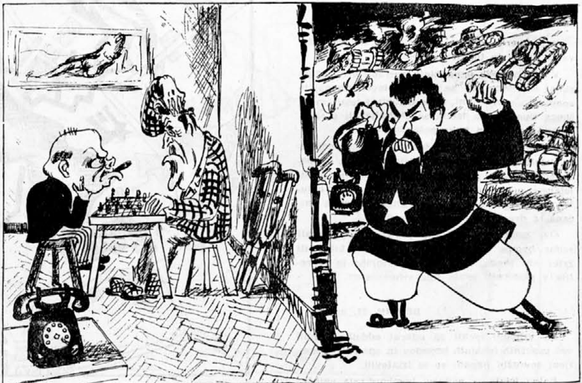
Brzo, orožje - prihajajo Nemci.

PETROGRAD — Odkar je mesto obkoljeno - je v njem umrlo za lakoto in trazine bolezni, že več, kot en milijon oseb. Jako se je v skrbeh, da se z gorkim vremenem pojavijo hude nalezljive bolezni - a to vsled velikega števila nepokopanih mrtvecev.