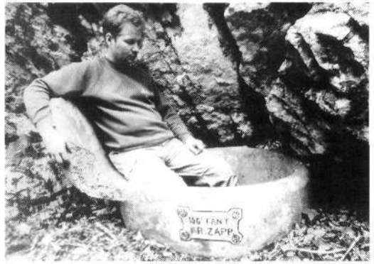
Vojaška banja kot kulturni spomenik

Pa si ga oglejmo! Je nad prekržižanima sekirama krilato kolo? Mar ni to simbol železničarjev? Kaj za vraga pa so počeli tukaj, tisoč metrov nad dolino? Razlaga je preprosta: italijanske žarometne enote so bile del 6. in-