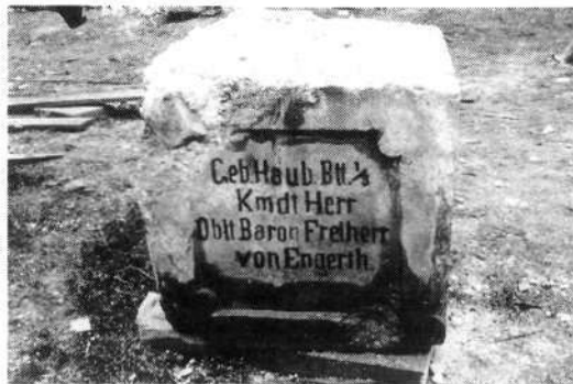
Z združenimi močmi ga lahko obvarujemo.

Z enega od napisov je razvidno, da je med vojno obeležje stalo pred barako 1. baterije gorskih havbic iz sestave avstro-ogrskega 3. polka gorskega topništva (glej tudi »klet junakov«). Bateriji je poveljeval nadporočnik baron von Engerth . Na dveh ploskvah sta v nemščini zapisani domoljubni gesli: »Bog varuj Avstri-