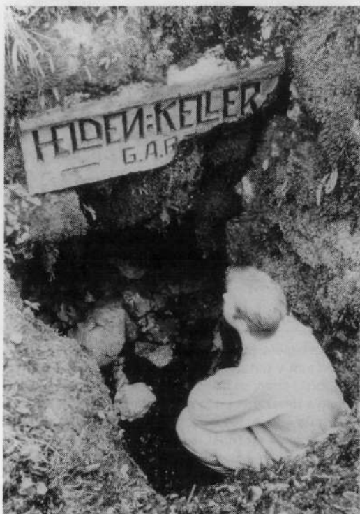
Za junaki je ostala le nepospravljena klet.

sed, ki je neštetokrat izrečena ali zapisana spremljala življenje in smrt v jarkih, nemška beseda Helden – junaki. Vse, kar so počeli vojaki, mobilizirani možje in fantje, ki niso hoteli biti junaki, temveč so si želeli le živi dočakati konec vojne, je bilo junaško.