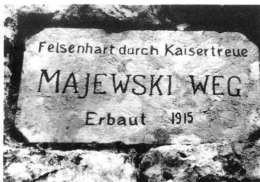
Enigmatični podpis graditeljev poti na planino Duplje.

lahko bile dobro vidne prve črke »Felse...« in zadnje »...reue« del gesla s stare vojne fotografije, je bila uganka kaj hitro rešena.