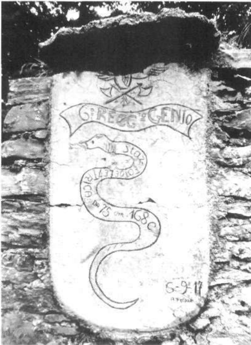
V gorah lahko najdemo tudi prav posebne kače.

ženirskega polka (reggimento genio) – železničarjev. »Tetovaža« na kači pravi, da je na tem vrhu stal električni 75-centimetrski žaromet 168. stotnije, desno spodaj pa lahko tako kot na vsakem umetniškem delu preberemo datum (6. 9. 1917) s podpisom avtorja ( A. Pecora ). Le-ta ga je polomil le v eni stvari: kača bi morala bruhati ogenj na desno stran, v tisti smeri je bil namreč avstro-ogrski sovražnik. Ali pa so morda avtorjeve preroške roke nehote upodobile s hitrimi koraki bližajočo se temno italijansko usodo? Le poldrugi mesec zatem, ko se je podpisal, je namreč prišel znameniti 24. oktober 1917 in z njim katastrofalni poraz italijanske vojske.