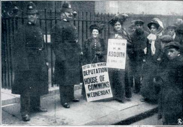
ZA ŽENSKO VOLILNO PRAVICO: DVE SUFFRAGETKI KOT POŠTNI POŠILJATVI POSLANI MINISTRSKEMU PREDSEDNIKU ASQUITHU

teljevo. „Mohorjeva družba“ je „bratovščina“ in „Večernice“ imajo pri nas skoraj neki pobožen pomen. Naše „Večernice“ niso maloruske „večernici“, kjer se shajajo fantje in dekleta na zabave, ampak „večernica“ je pri nas predvsem „večerna pobožnost“ doma ali v cerkvi. Treba se je na to ozirati in pomisliti, da ima Cankarjevo ime pri nas neki čisto poseben