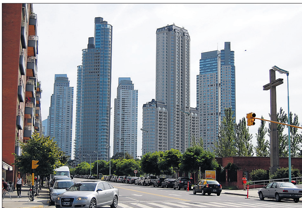
Prestičen del Buenos Airesa – Puerto Madero

Monopol nad notranjimi leti v Argentini ima nacionalna letalska družba Aerolíneas Argentinas, ki pa na žalost turistov izvaja dvojno cenovno politiko. Tako ena cena velja za domačina, turist pa mora plačati več – koliko več, je odvisno od tega, iz katere države prihaja. Omenjen krivičen in zaple-