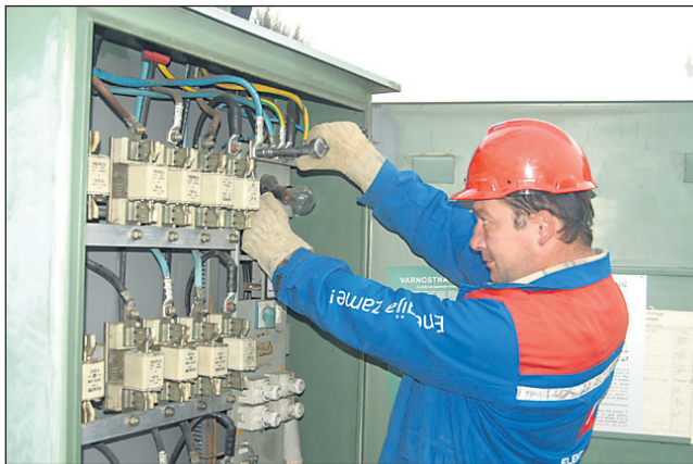
Skupni znesek za preveč plačano električno energijo, ki naj bi ga Elektro Maribor vrnil svojim odjemalcem, je okoli 3 milijone evrov.

Ljutomer • Končan je 6. Grossmanov festival