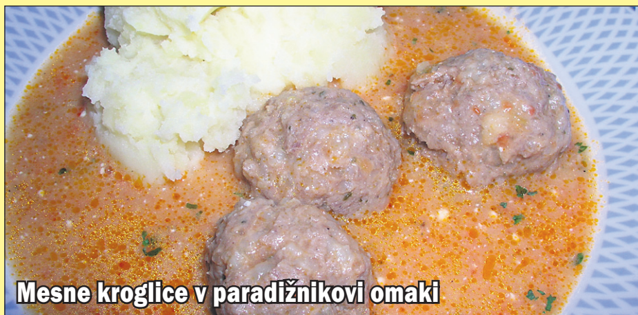
Mesne kroglice v paradižnikovi omaki