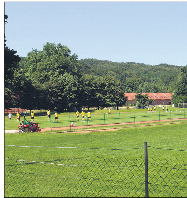
ŠRC z nogometnim igriščem