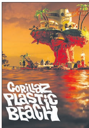
Gorillaz - Plastic Beach

Idejni vodja in tihi šef virtualne svetovno znane hiphop zasedbe Gorillaz Damon Albarn je potrdil, da se skupina, ki je zelo znana tudi po tem, da se zelo redko odpravlja na turneje, namerava kmalu odpraviti na svojo prvo veliko svetovno turnejo. Turnejo, na kateri bodo predstavljali svoj zadnji studijski album Plastic Beach , bodo pričeli na odrih v ZDA, nadaljevali po Evropi, kjer je že znanih