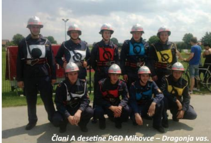
Člani A desetine PGD Mihovce – Dragonja vas.