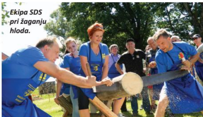
Ekipa SDS pri žaganju hloda.