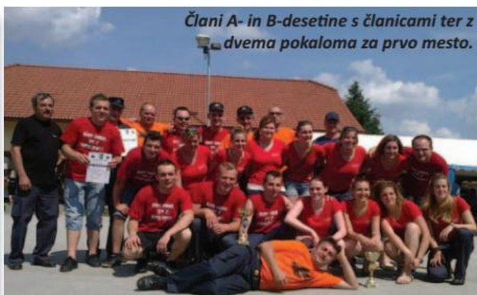
Člani A- in B-desetine s članicami ter z dvema pokaloma za prvo mesto.