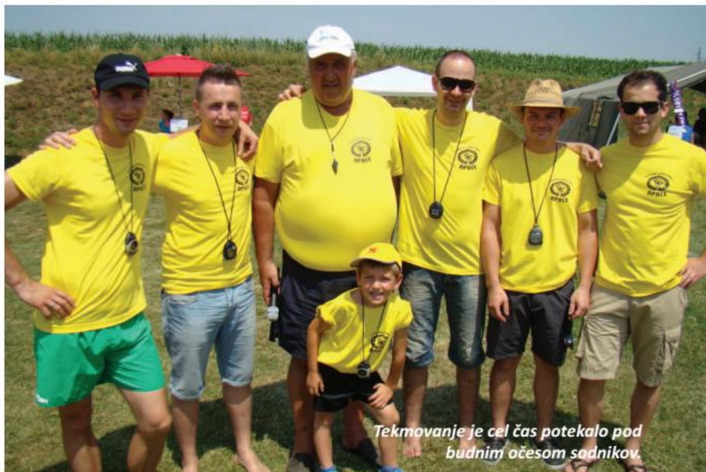
Tekmovanje je cel čas potekalo pod budnim očesom sodnikov.

ki smo ga za potrebe iger pripravili organizatorji, nekateri pa so se raje držali v senci pod šotorom s hladno pijačo v roki. Skratka, igre so potekale v prijetnem in sproščenem vzdušju ter s precejšnjo mero tekmovalnosti, saj so si vse ekipe želele prejeti prehodni pokal. A na koncu je to uspelo le eni ekipi, in sicer so že drugič zapored zmagali člani PGD Jablane, ki so s številom doseženih točk dokazali, da so zasluženo najboljši. Na drugem mestu so bili Apački prišleki, tretje mesto pa so si prislužili plesalci FS Vinko Korže Cirkovce. Čestitke zmagovalcem! Člani PGD Apače se vsem tekmovalcem in obiskovalcem zahvaljujemo za udeležbo in vas vabimo, da se nam pridružite zopet naslednje leto!