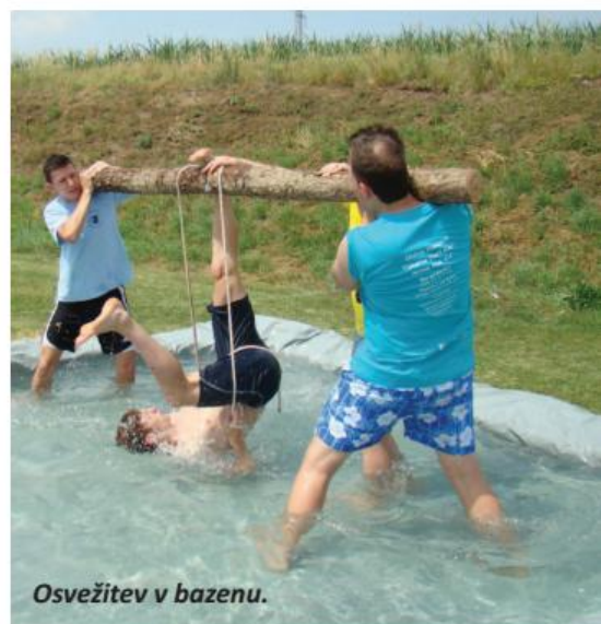
Osvežitev v bazenu.