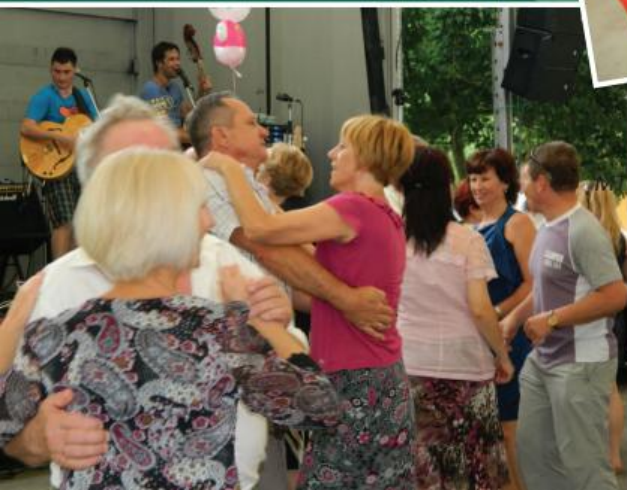
◀ Zabava v preditvenem šotoru se je začela ob zvokih ansambla Fantastičnih 6 ter nadaljevala z ansamblom Donačka.