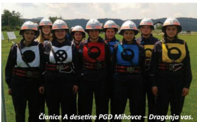
Članice A desetine PGD Mihovce – Dragonja vas.

udeležba na marsikaterem tekmovanju izven občine je bilo tokrat poplačano. Članice so prav tako morale izvesti tri naloge, in sicer vajo z motorno brizgalno, teoretični test in vajo razvrščanja. Prvega mesta so prav tako bili veseli člani A desetine, ki so že četrto leto zapored domov odnesli pokal za prvo mesto. Člani so opravljali enake naloge kot članice. Prav takšne pa so opravljali tudi člani B desetine, ki pa so dosegli 4. mesto z enakim