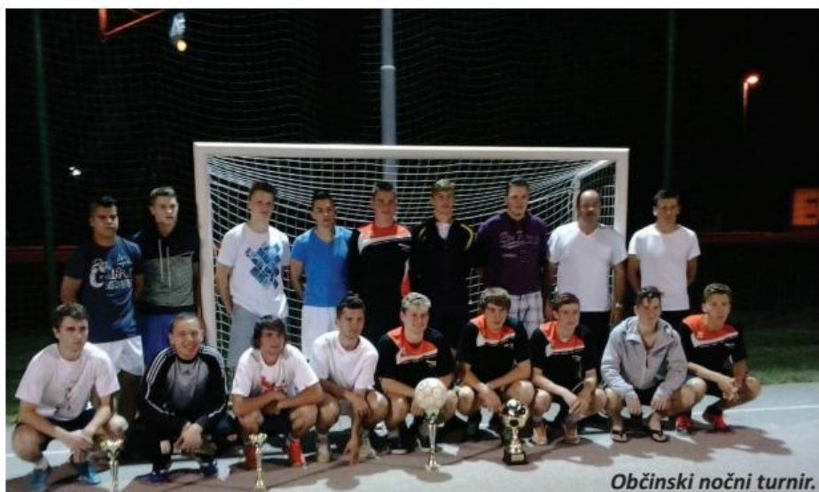
Občinski nočni turnir.