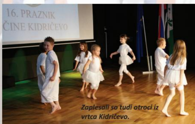
Zaplesali so tudi otroci iz vrta Kidričevo.