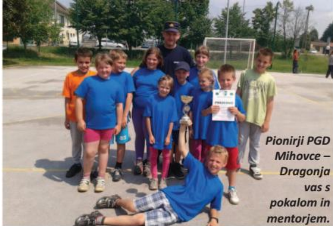
Pionirji PGD Mihovce – Dragonja vas s pokalom in mentorjem.