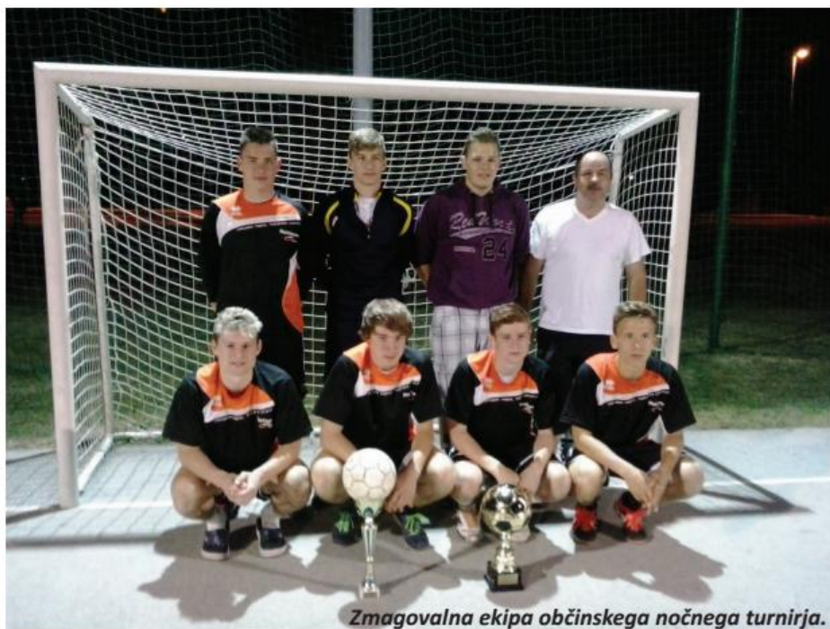
Zmagovalna ekipa občinskega nočnega turnirja.

Športno društvo MLADINEC Lovrenc je okviru 16. občinskega praznika Občine Kidričevo organiziralo tradicionalni nočni turnir v malem nogometu. Športna prireditev je bila organizirana za vsa športna (nogometna) društva v občini Kidričevo, neomejeno glede starosti in spola. Prireditev se je odvijala v petek, 21. 6. 2013, od 20. ure naprej v Športnem parku Lovrenc v Lovrencu na Dravskem polju. Turnir – prireditev je trajala do 3. ure zjutraj. Na nočni turnir v malem nogometu je bilo prijavljenih 14 ekip iz celotne Občine Kidričevo.