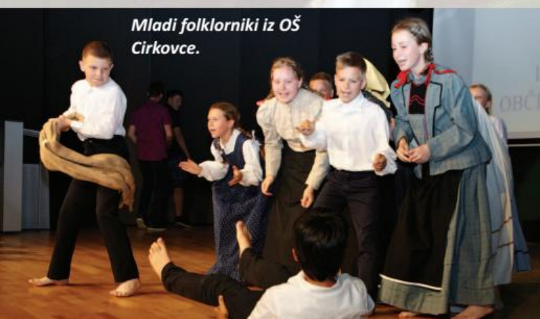
Mladi folklorniki iz OŠ Cirkovce.

ter občinskimi svetniki, izpostavil pa je tudi prizadevanja, da bi občina Kidričevo postala sinonim za občino dobrega počutja, kakovostnega bivalnega prostora ter razvoja. Navzoči so si na osrednji prireditvi lahko zraven izbranih govoro-