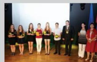
Fotografije na naslovnici: Foto Langetholc

Vljudno vabljeni, da nam svoje prispevke za naslednjo izdajo Ravnega polja pošljete do 12. 9. 2013 na elektronski naslov: mojca.trafela@yahoo.com