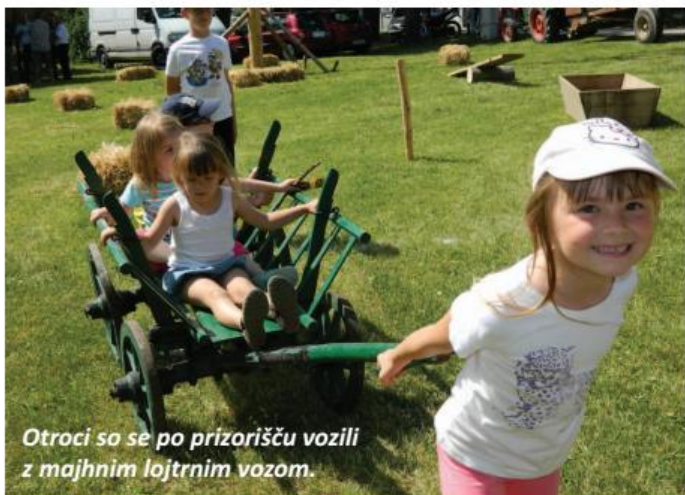
Otroci so se po prizorišču vozili z majhnim lojtrnim vozom.