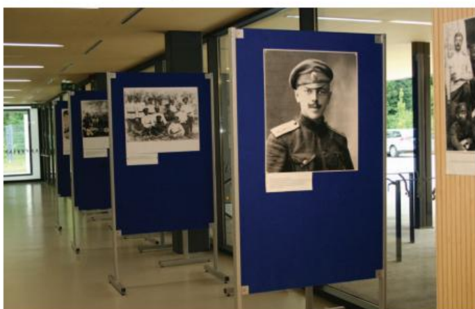
▲ Razstava »Portreti ruskih vojakov« v počastitev spomina na rusko ujetniško taborišče v Strnišču (1915–1918) in taborišče ruskih beguncev v Strnišču (1920–1922).