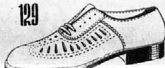
3039-24674 Moški lahki nizki čevlji, z olivrom, izdelani iz finega usnja, okrašeni luknjicami in usnjenim podplatom.