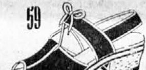
36915-3441 Udobni čevljički iz rdečega bureta, z gostimi prožnimi podplati. Za tople dneve posebno prikladni.