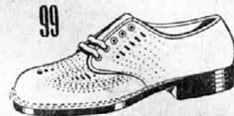
27-44683 Elegantni poletni čevlji za gospode! Iz sivga in drap semša ali iz usnja, okrašenega z luknjicami, z usnjenim podplatom.