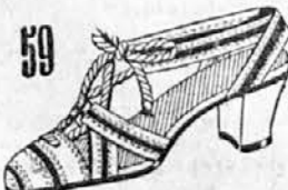
60695-3938 Lahki ženski čevlji iz močnega angleškega platna, kombinacija v rdeči, modri in zeleni barvi. Posebno lepo zunanost jim dajejo okrasni trakovi.