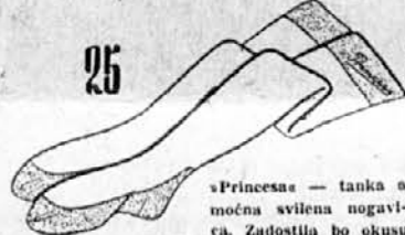
Princesa — tanki a močna svileni nogavica. Zadostila bo okusu vsake dame.