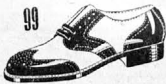
9927-0713 Moderni čevlji gospodom za poletje. Izdelani so iz javega usnja, kombinirani s platnom, z usnjenim podplatom.