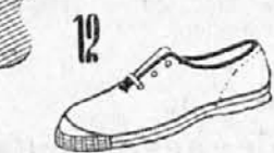
45301-2204 Za lepe dneve najcenejši in najudobnejši otroški čevljički z gumijastim podplatom. Otroški Din 12.— in 13.— ženski Din 18.— moški Din 25.—