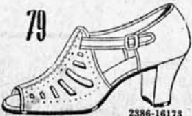
2386-16173 Novi model iz Nice! Izdelan iz finega belega nubuka, z modernim visokim nartom. Okusno izrezane, dajejo nogi dovolj zraka. Princesa. — Tanki a močna svileni nogavica, ki bo zadostila okusu vsake dame.