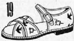
45401-8801 Otroški čevljički z zaponko. Izdelani iz močnega angleškega platna v drap barvi, s prožnimi gumijastimi podplati.