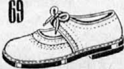
5392-14859 Otroški bell čevljički iz nubuka, ki so kombinirani z usnjem, in usnjenimi podplati. Za hinkoži boste najbolj razveselili otroke s temi čevlji.