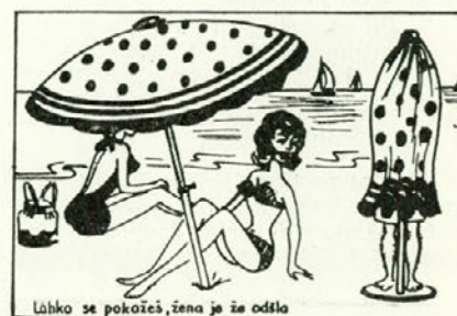
Lahko se pokaže, žena je že odšla