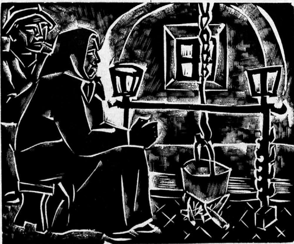
Slovenska kuhinja na Krasu (linorez) — A. Černigoj

Naročnike in bralce obveščamo, da zaradi običajnih poletnih počitnic prihodnja številka Novega lista ne izide v četrtek, 18. t. m., temveč en teden kasneje, to je 25. avgusta.