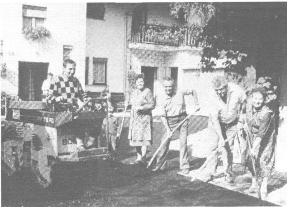
Asfaltiranje zadnjega dvorišča