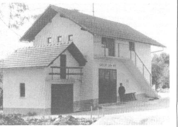
Ponos Vršanov: novi gasilski dom