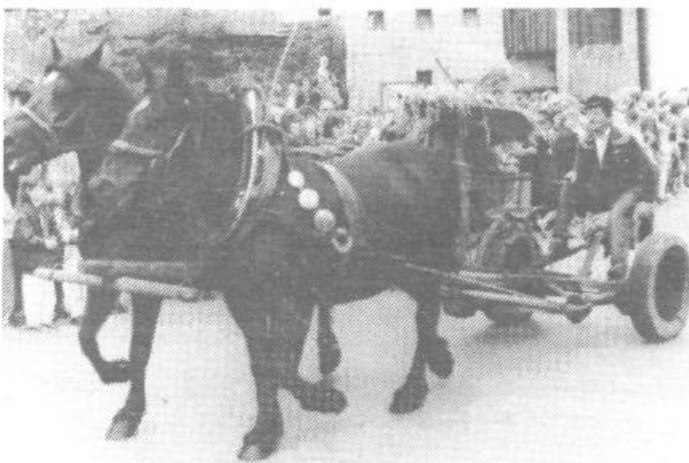
Tako kot v starih časih: kosilnica s konjsko vprego