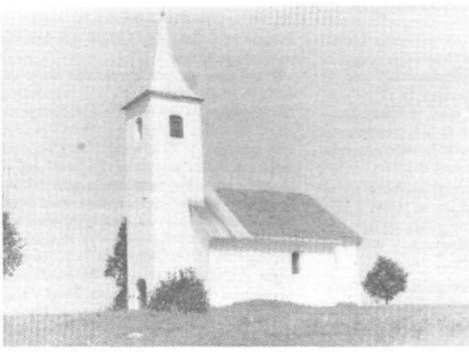
Cerkva Sv. Petra je gotovo ena najlepših na pijavgoriškem območju