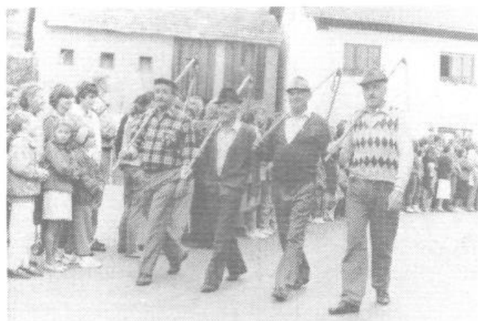
Kosci kot v drobrnih starih časih. To pot žal le na asfaltu...