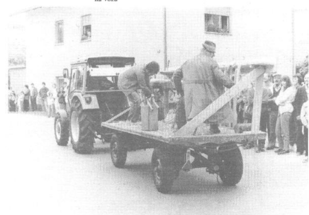
Mizarji pri »delu«