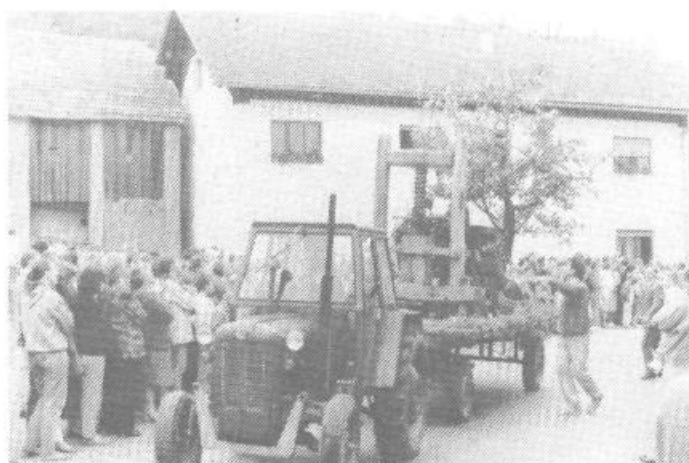
Ena najbolj atraktivnih točk parade: ekipa sadjarjev s pravim drevesom na vozu