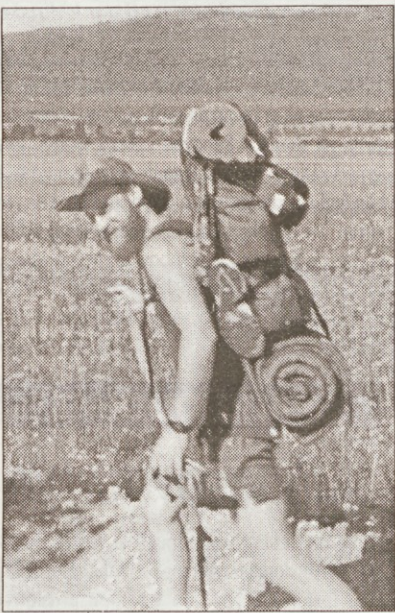
Prečkanje Cerknškega jezera

vala pot preko strelšča Poček, čez Javornike, kjer sva se pri sestopu na cerknško stran malo izgubila in napravila kakih 10 km dolg ovinek. Končno sva prišla do Cerknškega jezera. Prečkala sva ga po makadamski cesti, prišla v Cerknico in še isti dan do Begunj. Tu sva tudi tretjič prespala.