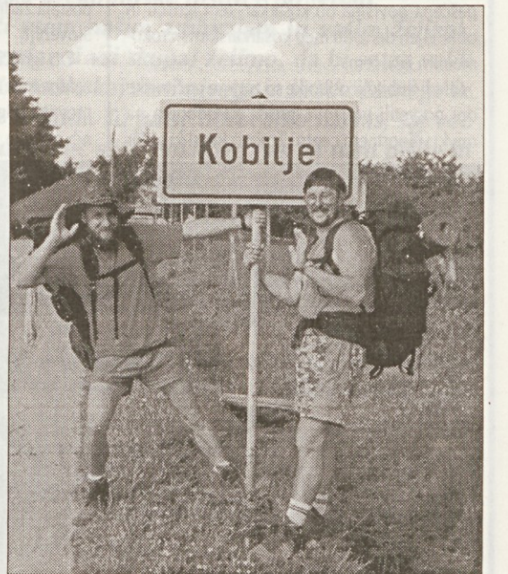
Na koncu poti

Že dolga leta me je spremljala želja, da bi enkrat prehodil našo deželo - Slovenijo. Pa je bilo vedno nekaj, da nisem mogel na pot. Ampak lani, na nekem pohodu, sem na zatrdno sklenil: drugo leto pojdem za-