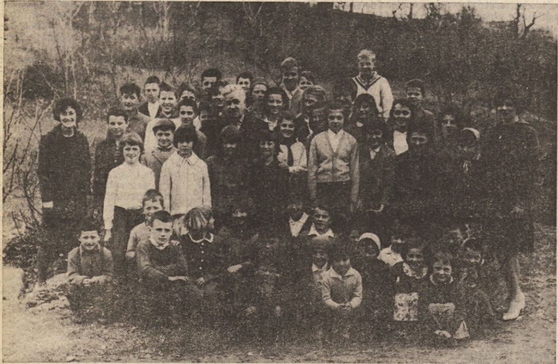
Pisatelj France Bevk s šolsko mladino v Šebreljah

France Bevk pripada vsemu slovenskemu narodu, v veliki meri usej jugoslovanski skupnosti in s svojimi knjigami, ki so prevedene v mnoge tuje jezike, v splošno človeško zakladnico