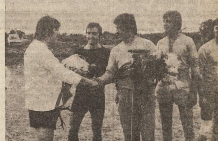
V okviru gropskega vaškega praznika so se pomerili med seboj tudi starti in mladi nogometaši. Zgoraj: izmenjava daril med kapetanoma; spodaj: obe enajsterici na spominskem posnetku