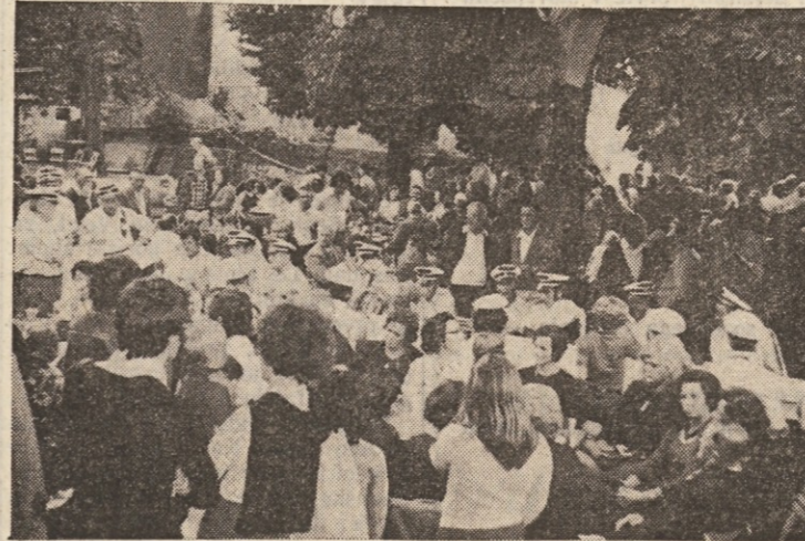
V Ljudskem domu v Trebčah je bil tradicionalni praznik komunističnega tiska s kulturnim in športnim sporedom