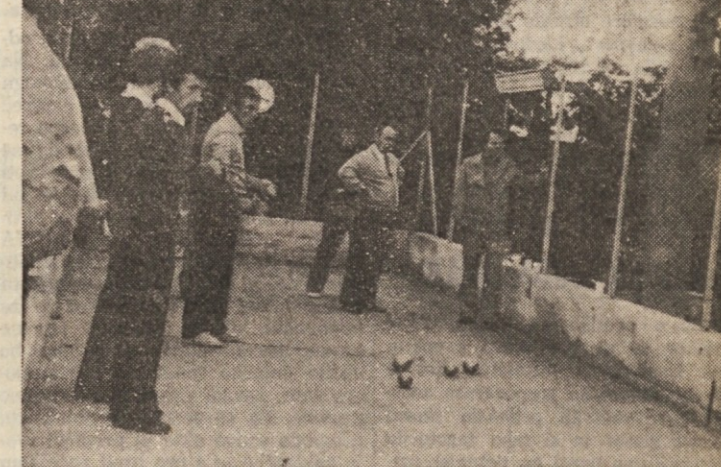
Tudi balinarji so preskusili novo balinišče, in to uspešno