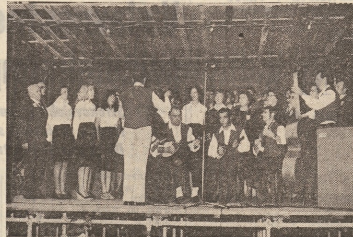
V Boljuncu je PD «France Prešeren» priredilo šagro na Jami. Čisti dohodek je namenjen za nakup oblačil članov pevskega zbora, ki je tudi nastopil na prireditvi