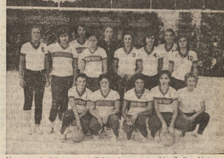
Na novem igrišču sta opravili krstni nastop ženski odbojkarji sestertki Sokola in Kontovela