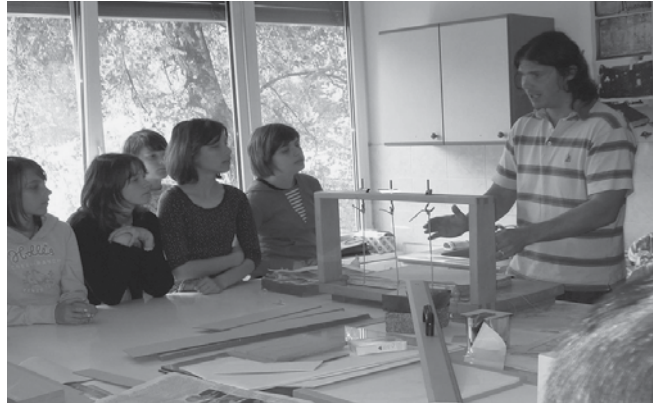
V restavratorski delavnici.

Učencem se zelo vtisne v spomin restavratorska delavnica. Ob predstavitvi restavriranja izvedo, da le-to zahteva veliko mero natančnosti in potrpežljivosti, še posebej so začudeni ob podatku, koliko časa se porabi za restavriranje. Učencem je tudi všeč, da v arhivu stopijo med arhivske police, kamor običajni obiskovalci nimajo dostopa. Malo manj pa, da morajo na predstavitvi arhiva stati. Nimamo namreč predavalnice. Le kadar ni obiskovalcev v čitalnici arhiva, jim predstavitev lahko pripravimo tam.