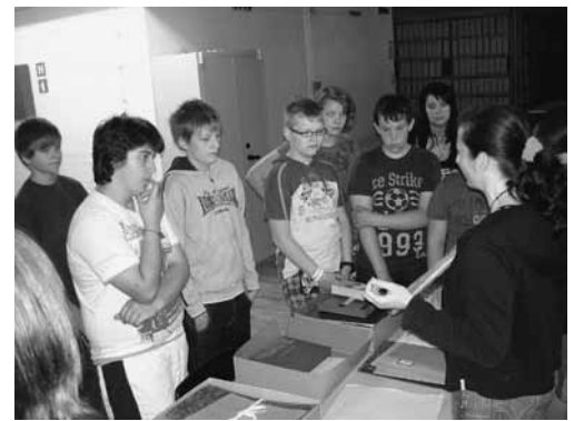
Obisk arhivskega skladišča.

Skupinam, ki za ogled arhiva namenijo malo več časa, predvajamo tudi dokumentarni film o delovanju Zgodovinskega arhiva Celje. 15