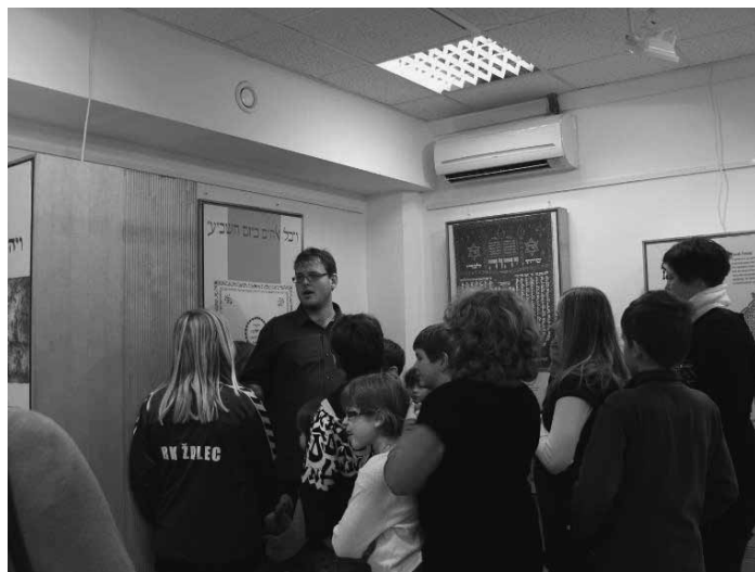
Učenci pozorno sledijo predstavitvi razstave Umetnost hebrejske pisave.

V obravnavanem desetletnem obdobju smo v Zgodovinskem arhivu Celje pripravili samostojne razstave, razstave v sodelovanju z drugimi kulturnimi institucijami, gostili pa smo tudi razstave drugih slovenskih arhivov kot tudi razstave iz tujine in upam, da smo dali svoj delček k realizaciji navedenih ciljev. Obisk razstav je bil zelo dober, tako osnovnošolske kot srednješolske skupine pa so si jih ogledale pod strokovnim vodstvom avtorjev.