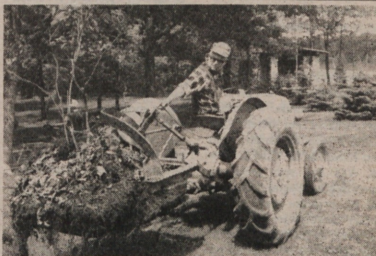
Slavljenec Ralph Coffelt na traktorju v Parku

V nedeljo, 19. marca, je na svojem lepem domu na West