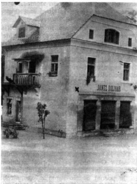
Pri trgovini J. Dolinarja v Poljanah je voda segala do označene (x) višine

letom. Lahko bi jih navedel lepo število. Zanimivo je, da je samo v Gorenji vasi in bližnji okolici bilo julija in avgusta prek 250 nočnin. Ob vodi je bilo zelo živahno, večeri prijetno družabni. V Poljanah, Gorenji vasi in na Selu pa so bile številne kabine za kopalce. Kako prijetno osvežujoča je bila v vročih poletnih dneh ne premrzla Sora!