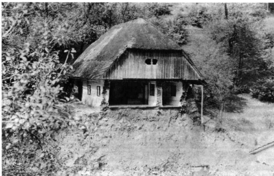
Od povodnji razdejana hiša sekirnega kovača Krmelja v Hotovlji

Dne 14. septembra 1925 sem za stalno prišel v Gorenjo vas in pričel z delom. Ker sem bil mestni otrok-Ljubljančan, ki je poznal deželo samo z lepe strani, sem kaj hitro okusil, kako težko je »orati ledino«. Toda naporji me niso mogli prestrašiti. Bil sem vseskozi zdrav, zelo krepak in mlad — nisem še dopolnil 25 let — ter vnet orodni telovadec,