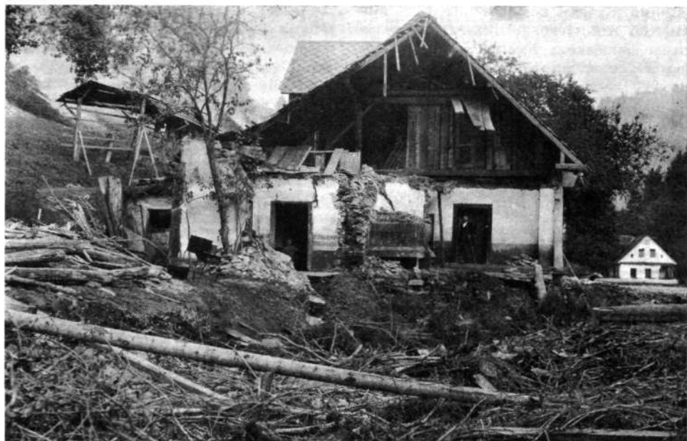
Voda je odnesla pol hiše gostilne Bogataj (Pri mostarju) v Hobovšah

edini še streho (do poplave leta 1925 so jo imeli skoraj vsi mostovi v Poljanski dolini) izdatno popravili in mu zbetonirali stoge ter napravili pločevinasto streho.