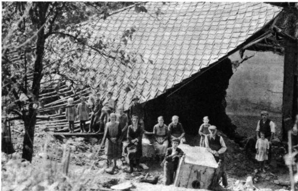
Del razdejanega Fortunovega mlina v Hotovljah