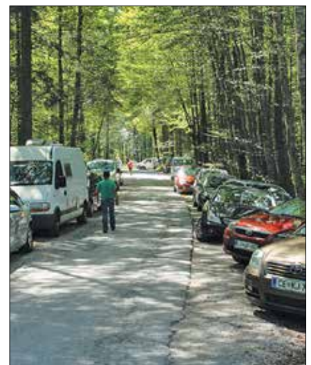
Za praznik dela je vstopnino v Logarsko dolino plačalo skoraj 700 voznikov avtomobilov, devet kombijev in 14 motoristov.