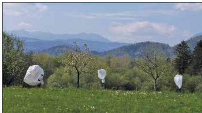
Spomladi leta 2016 in 2017 je mrzlo vreme precej prizadelo pridelke. Manjša drevesa so lastniki predhodno zaščitili.

tnega preobrata temperature niso tako padle.