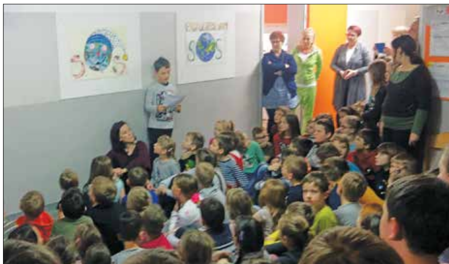
Drugošolec Nal je prebral sporočilo mladih Osnovne šole Mozirje.