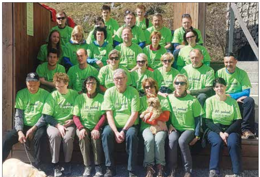
Tudi na trideseti pohod je prišlo skoraj trideset udeležencev.