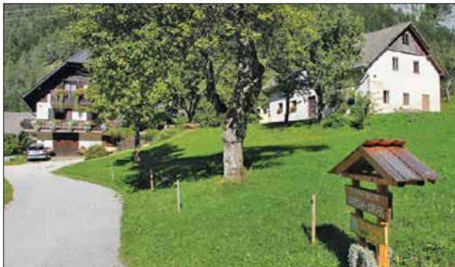
V Solčavi in Lučah delujejo turistične kmetije z najdaljšo tradicijo v Sloveniji, zato imajo bogate dolgoletne izkušnje pri delu z gosti, ki se vedno radi vračajo.

Slovenija je nosilka naziva Evropska gastronomska regija 2021. Letos si bo naša država prizadevala s promocijo slovenske kulinarne kulture in tesnejšim povezovanjem prehranske politike, gostinstva, turizma ter kmetijstva doseči boljšo kakovost življenja. Zato je ta naziv odlična priložnost tako za gostince kot tudi za kmetovalce. Sedanji so lahko tako v vlogi pridelovalca hrane kot v vlogi nosilca turistične kmetije. Zgornjesavinjski kmetovalci so v svoji panogi med vodilnimi v slovenskem prostoru, naziv Evropska gastronomska re-