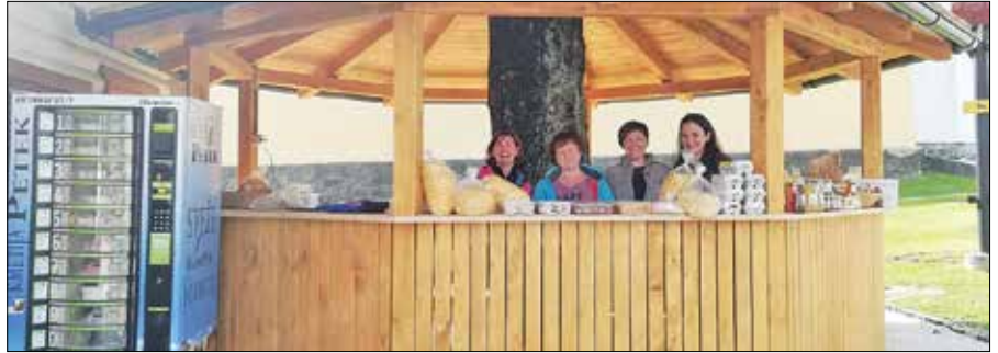
Sobotna tržnica domačih izdelkov je dobila nov prostor.

V Gornjem Gradu ob sobotah dopoldan deluje tržnica z domačimi izdelki. Le-ta je bila do sedaj pred Galerijo Štekl, v maju je dobila svoj stalni prostor le nekaj metrov stran. Prostor je zgrajen iz lesa in ima streho, kar pomeni, da ni več treba tedensko postavljati stojnic za ponudnike. Tudi vreme prodajalcev ne bo več nagajalo. Na tržnici so trije redni ponudniki, ki prodajajo domač kruh, jajca, testenine, kekse, pecivo, žlinkrofe, med in medene izdelke ter še marsikaj drugega, odvisno od sezone.