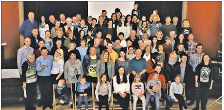
Preko osemdeset sedanjih rodbinskih potomcev Miklavc-Purnat v Gornjem Gradu

PRIČEL SE JE TEDEN LJUBITELJSKE KULTURE 2019