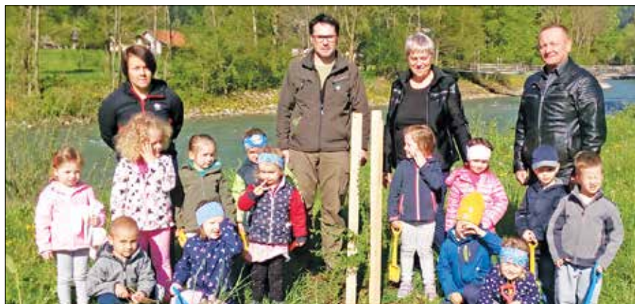
Otroci so v popotnico rasti drevesa na novi lokaciji zapeli pesem.