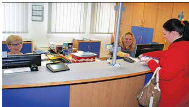
Na okencih, kjer poteka sprejem vlog, je pred začetkom poletja vedno povečano število strank. (Fotodokumentacija UE Mozirje)

Potrebna je fotografija, ki mora kazati pravo podobo in ne sme biti starejša od šest mesecev, ali referenčna številka iz E-fotograf (sli-