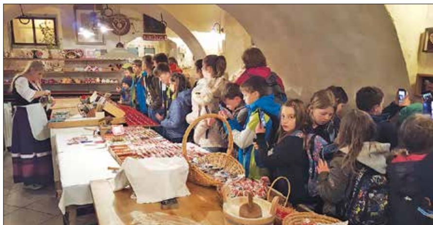
Udeleženci ekskurzije so si v Radovljici ogledali muzej Lectar in Čebelarški muzej ter se poveselili na Festivalu čokolade.