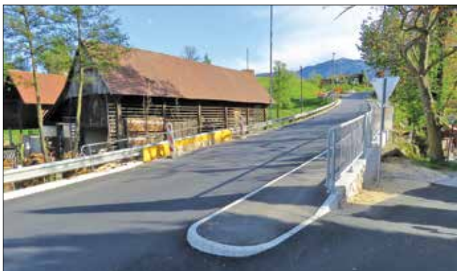
Sanacija v Radmirju je potekala na dolžini okoli 1.200 metrov.