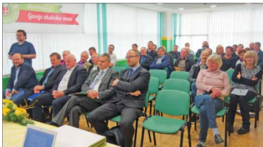
Udeleženci občnega zbora so z zadovoljstvom prislunili posameznim spodbudnim poročilom.

politike zadruge. »Pri tem ne gre pozabiti, da je kmetijstvo izpostavljeno velikim tveganjem, od vremena do dnevne politike.«