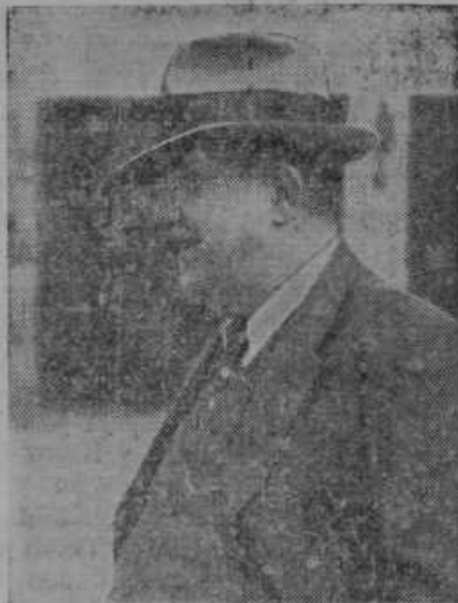
Jouhaux, povzročitelj in vodja zadnje ponesrečene in od Moskve naročene generalne stavke v Franciji

Krčevina pri Vurbergu. V zadnjem času prihajajo iz vasi onstran Drave, in to: Slovenja vas, Hodoše, ljudje, odnosno fantje v naše kraje po-