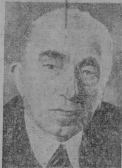
Dr. Emil Hacha, novi predsednik češko-slovaške republike

pivat. Prihajajo pa oboroženi s sekirami, noži in drugimi predmeti kot nad razbojnika. Menda z namenom, da v naših mirnih Krčevinah delajo nasilje in nemir, kot se je dejansko že zgodilo. Prosimo občine, iz katerih fantje prihajajo, predvsem pa starše teh fantov, da skušajo preprečiti