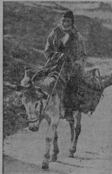
Kmet iz francoskega otoka Korzika v Sredozemskem morju, radi katere je nastal spor med Italijo in Francijo