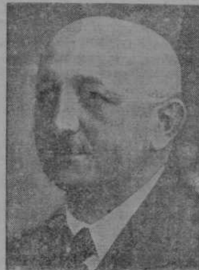
Beran, predsednik nove češko-slovaške vlade

pivat. Prihajajo pa oboroženi s sekirami, noži in drugimi predmeti kot nad razbojnika. Menda z namenom, da v naših mirnih Krčevinah delajo nasilje in nemir, kot se je dejansko že zgodilo. Prosimo občine, iz katerih fantje prihajajo, predvsem pa starše teh fantov, da skušajo preprečiti