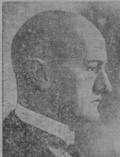
Filip Etter, najmlajši član švicarskega Zveznega sveta, je bil izvoljen za predsednika republikanske Zvezne države Švice za leto 1939