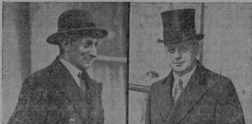
Nemški zunanji minister von Ribbentrop (desni) in francoski zunanji minister Bonnet (levi) sta podpisala v Parizu 6. decembra izjavo o spoštovanju mej med Francijo in Nemčijo