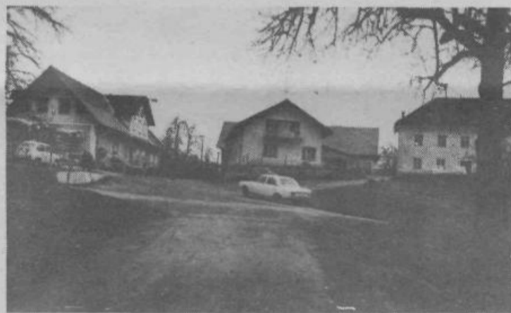
Pogled na center Stične danes