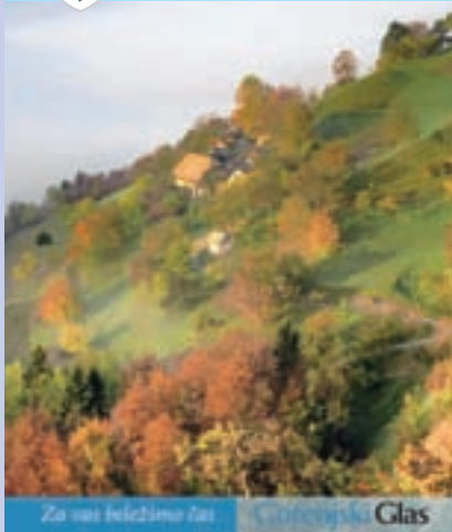
Za vas beležimo let Glas

Na naslovnici: Jesen