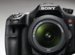
Digitalni fotoaparāt SONY SLT-A65VK

Nova serija prenosnika Sony VAIO EA vam nudi več zabave in tehnologije. Poleg hitrih komponent in nove grafike, ima ta model tudi HDMI priključek, zaslon s tehnologijo LED ter izjemen design.