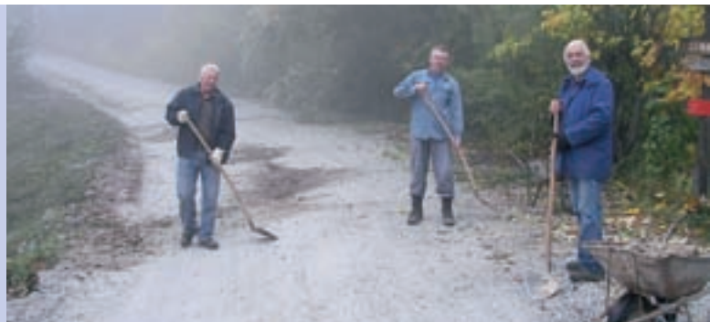
Del krajanov na Belem se je lotilo popravila občinske ceste.