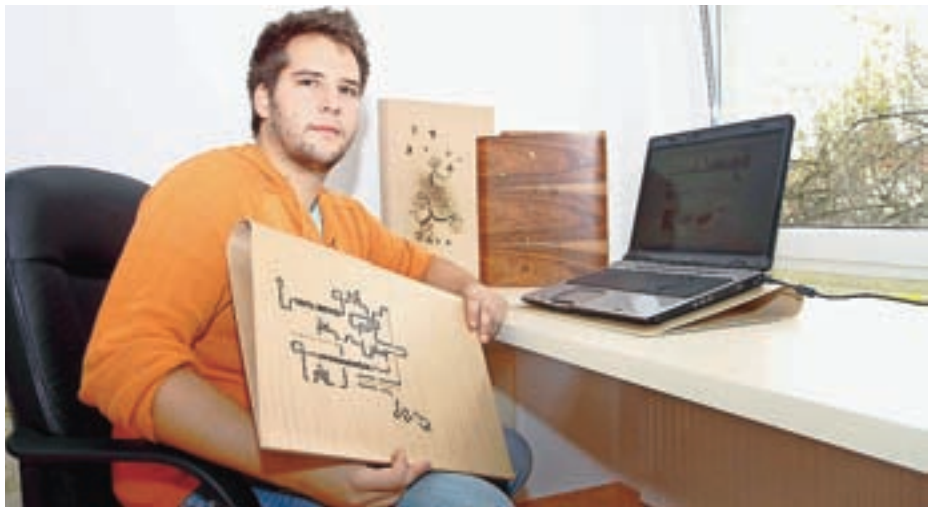
Upognjenček je izdelan iz ukrivljene vezane plošče, odprtine pa so izrezane z laserskim rezalnikom in odvisne od želja stranke. V Sloveniji je oblika podloge zaščiten.