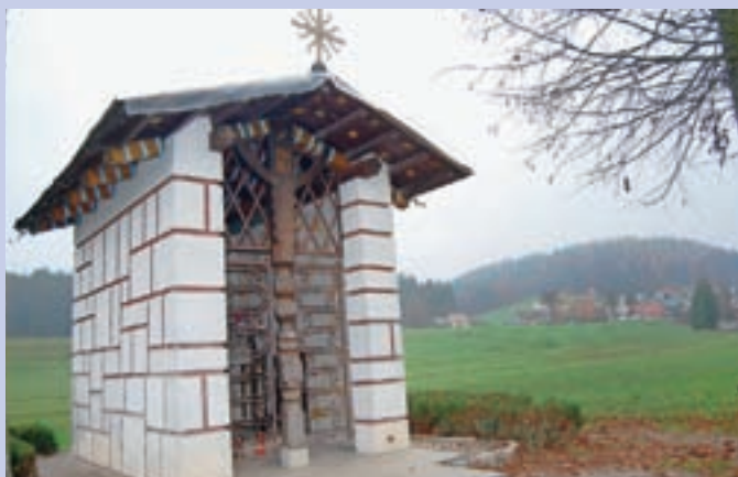
S Plečnikove kapelice so neznani storilci ukradli baker.