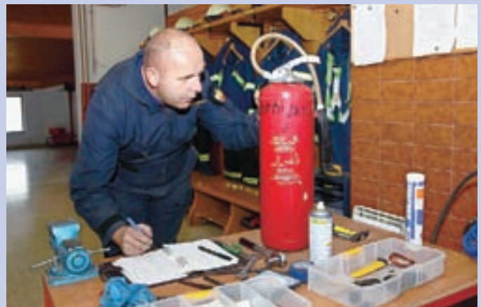
V Sori je serviser gasilnike pregledal takoj, tako da so jih občani lahko po nekaj minutah že odnesli domov.