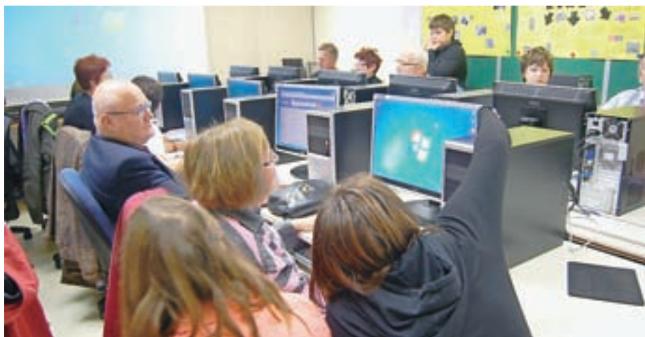
Projekt Simbioz@ e-pismena Slovenija na OŠ Pirniče

Več povpraševanja, kot je bilo prostih mest, so zabeležili tudi v Knjižnici Medvode. Vseh šest prenosnih računalnikov je bilo zasedenih, še enkrat več pa se je pokazalo, kako potrebna