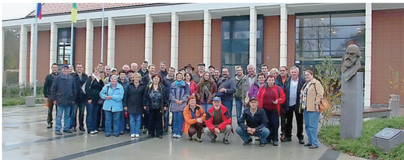
Medvoški kulturniki pred Kulturnim centrom Primoža Trubarja v Šentjerneju