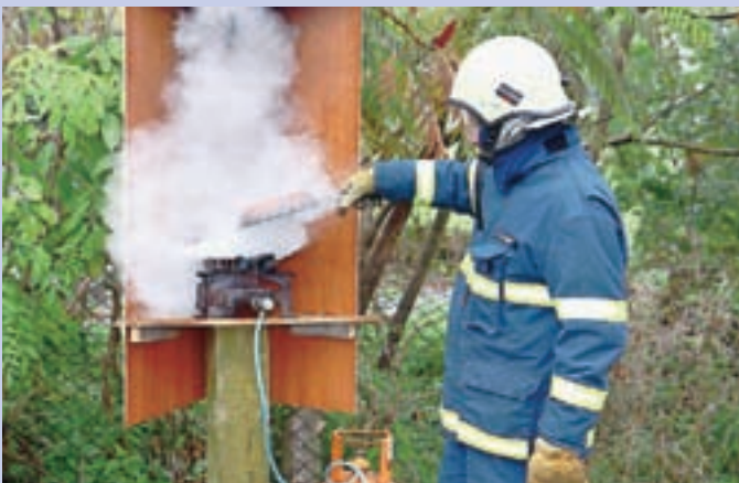
Goreče olje na štedilniku pravilno pogasimo tako, da posodo pokrijemo s pokrovko ali drugo posodo ter tako ognju preprečimo dostop do kisika.