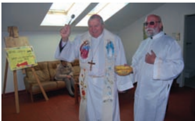
Blagoslovil jih je ljubljanski nadškof v pokoju Alojz Uran. Kot je dejal, bodo novi prostori pomagali utrditi povezanost tudi na mednarodni ravni.