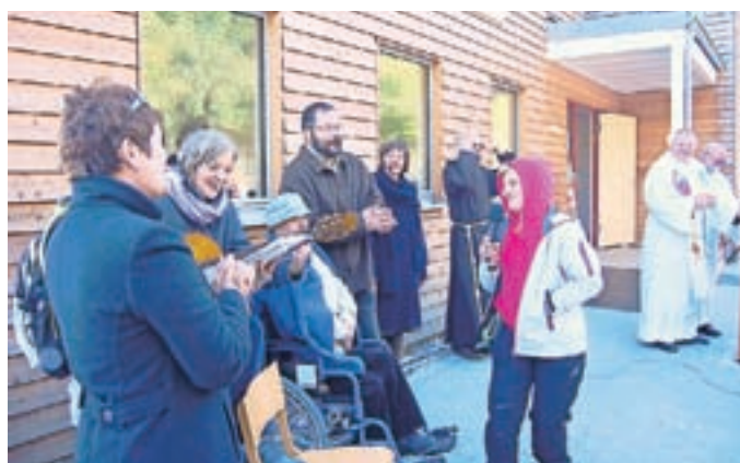
Odprtje so s pesmijo popestrile tudi sprejete osebe. V programu pa so zapele še Sorške kresnice.