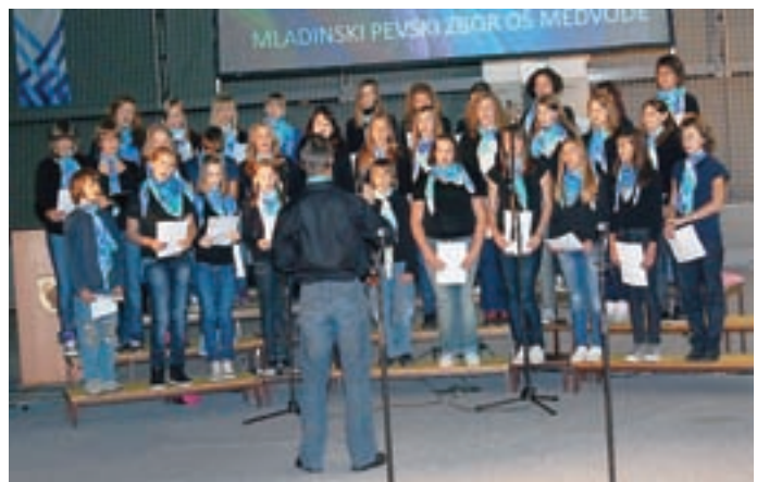
... pa tudi s petjem.