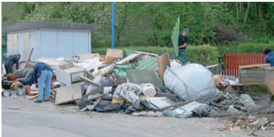
Masovno zbiranje kosovnih odpadkov je že preteklost. Fotografija je bila spomladi posneta v Zbiljah.

Ponekod imate torej poleg sivo-črne posode za ostale odpadke tudi rjavo posodo za biološke odpadke, če ne, pa je obvezno domači kompostnik. Nekateri odpadki se še naprej zbirajo na zbiralnicah. "V občini Medvode je nameščenih 88 zbiralnic. V zadnjem času se zaradi dviga količin predvsem ločeno zbrane embalaže pojavljajo problemi v zvezi s potrebnim volumnom posod za embalažo na zbiralnicah. Zato pripravljamo predlog sprememb načina