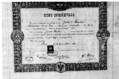
Učno spričevalo čevljarstvskega pomočnika.

Zadnja vitrina je posvečena tovarni Alpini v Žireh. V njej vidimo kopijo odločbe iz l. 1947 o ustanovitvi tovarne čevljev Alpina, fotografije prvih vajencev Alpine in poslopja, nekaj primerkov tovarniškega glasila Delo-življenje, kjer lahko vidimo tudi fotografije vseh dosedanjih direktorjev Alpine od njene usta-