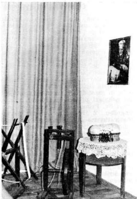
Del muzejske zbirke z opremo, ki je potrebna pri klekljanju.

njo otroci že v starosti okrog petih let, le da so jo fantiči navadno pozneje opustili.