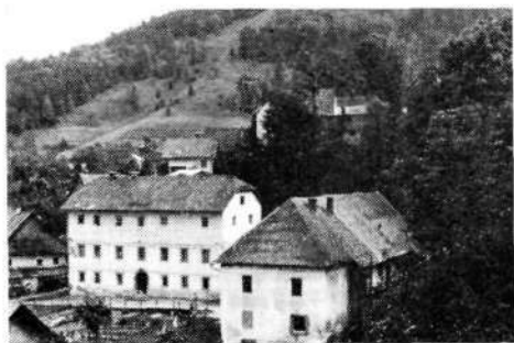
Stara šola v Žireh, kjer je nastanjena žirovska muzejska zbirka.

Dela bo dovolj, le dobre volje je treba... Sedaj se, četudi že največ na podstrešjih, še najdejo kakšni predmeti — ostanki čevljarjskega orodja, kot so: šila, smola za dreto, »rišpati«, kneftr« itd., morda slike delavnic in dokumenti o njihovem delovanju, pa delovnem dnevu čevljarjev do samih »na roko« delanih gojzarjev, »šihtavcev« in ljudi, ki vedo za vse to orodje domače izraze. Spominjajo se še tudi iz svojih izkušenj, kako so take čevlje delali, in še drugih stvari, ki jih je pomembno ohraniti.«