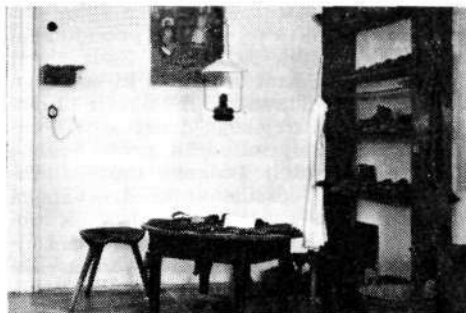
Del muzejske zbirke s čevljarškimi potrebščinami.

Najboljši časi so bili za žirovsko obrtniško čevljarstvo od konca prve svetovne vojne, ko so začeli kupovati žirovske čevlje gozdni delavci, rudarji, delavci na žagah in v tovarnah v Srbiji in Bosni, do velike gospodarske krize l. 1929. Tedaj je bilo v Žireh okrog šestdeset čevljarških delavnic, posebno močne so bile pri Gantarju v Novi vasi, pri Zajcu in bratih Naglič v Stari vasi. Da bi laže konkurirali, so se finančno šibkejši čevljarji združili v zadruga: l. 1931 Postolarska zadruga in zadruga Sora, l. 1934 Produktivna čizmarska zadruga, l. 1936 pa so