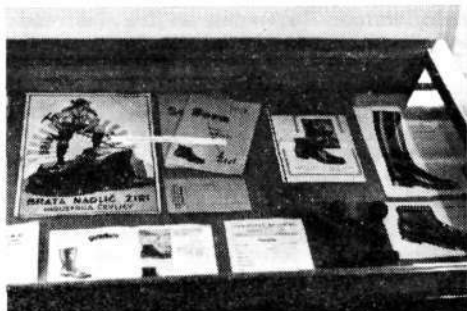
Ceniki in druga poslovna dokumentacija žirovskih čevljarjskih mojstrov.

Posebna zanimivost sta v zbirki salonka, ki ima gornji del čipkan z zlato nitko na rjavi podlagi, in čevlji izpod Himalaje, ki ga je podarila tovarni Alpini slovenska alpinistična himalajska odprava.