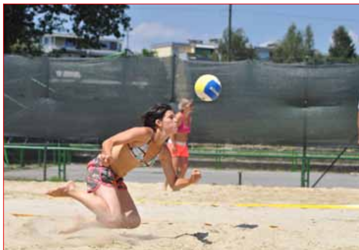
Odbojka na mivki, turnir v Ljubljani.

Veliko ljudi, ko slišijo za osebo, ki je gluha, razmišlja popolnoma drugačne kot je resnica. Tudi nam gluhim gre dobro, tudi mi znamo in zmoremo.