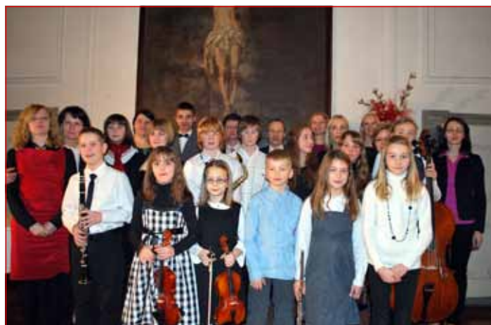
Gala koncert učencev Zasebne glasbene šole v samostanu sv. Petra in Pavla, ki je bil 3. februarja v refektoriju.

»Dolžnosti učencev so redno obiskovanje pouka individualnega predmeta ter nauka o glasbi. Pouk glasbene pripravnice in predšolske vzgoje je potekal enkrat tedensko 45 oz. 60 minut. Baletna pripravnica je potekala enkrat tedensko 90 minut. Vaje orkestrrov in pevskega zbora so potekale projektno – po dogovoru z mentorji (tudi ob sobotah). Uspeh vsakega učenca je odvisen od vloženega osebnega truda. Velik poudarek dajemo vzgoji, kako vaditi, ko učitelja ni zraven, kako pomembna je vsakodnevna vaja, seveda pa ne sme manjkati navdušenje nad instrumentom, za kar poskrbimo učitelji. Naši učenci velikokrat letno nastopajo, saj velja prepričanje, da z nastopanjem mladi glasbeniki pridobivajo nove izkušnje, ki jih zelo potrebujejo za nadaljnjo glasbeno pot, ob tem pridobivajo tudi na samozavesti in urijo igro na pamet. Naši nastopi se vrstijo v naši koncertni dvorani