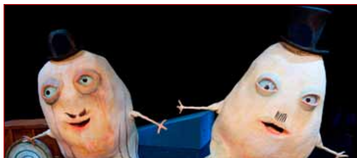
Utrinek iz nastajajoče predstave Kurent

»Pri gledališču se avtor besedila radikalno sooča z nekim dejstvom, ki je sicer univerzalno za vso književnost, a se pri nobeni drugi literarni zvrsti ne kaže