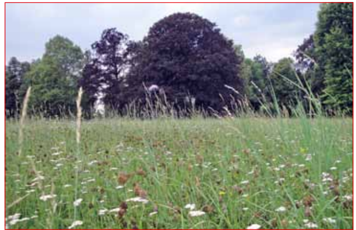
Organizacija združenih narodov je leto 2011 razglasila za mednarodno leto gozdov. Slovenijo prekriva kar 60, ptujsko območje pa 32 % gozdov.

in junija odvila dva dogodka. Evropohod 2011 je potekal v okviru dneva slovenskih planincev, glavna tema pa je bila »Pešpoti in voda«. Pot je potekala od Rogatca do Ormoža. Drugi dogodek, srečanje Pannonia, ki zadnjih 39 let povezuje gozdarje