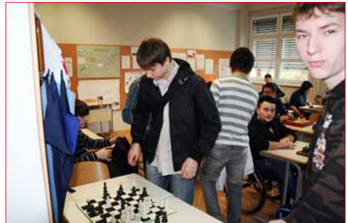
Dijaki so se lahko pomerili med seboj tudi na šahovskem turnirju.

Štirje dijaki so se 16. aprila udeležili državnega tekmovanja