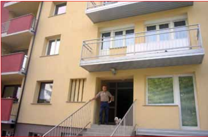
Sadik Rakovič je ponosen, da je blok v Kajuhovi ulici 5 po zaslugi vseh stanovalcev dobil novo, lepšo podobo.

25 %, kar znese okrog 23.000 evrov, celotna vrednost investicije je 90.000 evrov. Da bi preprečili nadaljnje odpadanje nove fasade, so naredili tudi padec na eno stran in odtok, kjer se zbirajo meteorne vode, ter temu ustrezno popravili balkone. Že pred tremi leti so v bloku zamenjali kletna okna, vhodna vrata, naredili nove stopnice in ograjo, šest let nazaj so obnovili kurilnico, uredili kletne prostore in sobo za sestanke, osem let nazaj so menjali tudi streho, vzorno je po zaslugi Adija Šarmana urejen