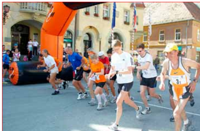
Start tradicionalnega 4. teka partnerskih mest Ptuja.

Podelitev priznanj vsem sodelujočim tekačem in podelitev pokalov ter medalj najboljšim trem ekipam v moški, ženski in mešani ter absolutni kategoriji in posameznikom je potekala ob 20. uri na Mestnem trgu. Tekmovalcem so najprej v pozdravnih nagovorih čestitali in se jim za-