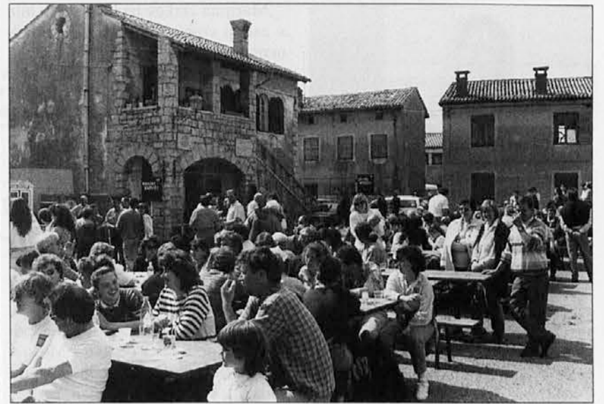
Na trgu v Mavhinjah

V nedeljo, 30. aprila, se je odvijal drugi pohod prijateljstva in odprte meje med Gorjanskim in Mavhinjami, ki ga je organiziralo društvo Cerovlje-Mavhinje pod pokroviteljstvom občin Komen in Devin-Nabrežina. Nedeljskega pohoda se je udeležilo več kot tisoč ljudi, kar je prispevalo k uspehu te prireditve, ki je bila pravi praznik obmejnega prebivalstva v znamenju sožitja, sodelovanja in odprte meje. Predlagali so tudi, da bi mejni prehod Gorjansko-Šempolaj v doglednem času postal mednarodni mejni prehod 1. kategorije.