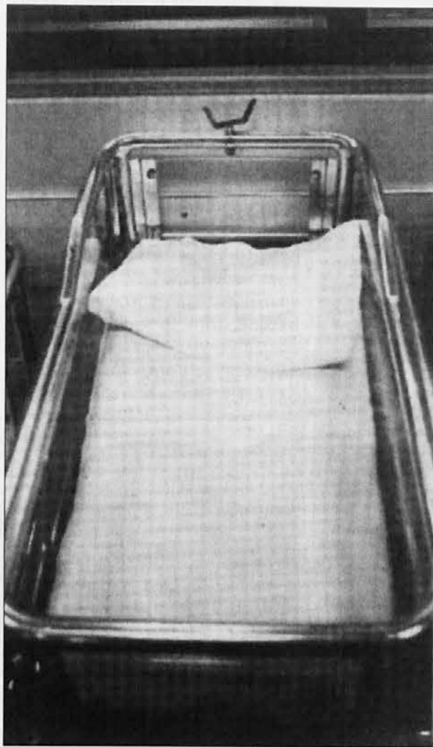
Prazna postelja je simbol naše družbe, ki ne mara več otrok