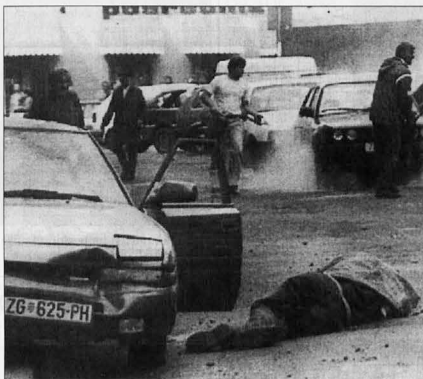
V torek, 2. maja, so bosanski Srbi z raketami napadli Zagreb. V napadu je bilo 5 ljudi mrtvih in 120 ranjenih. Vojna se torej nadaljuje in o premirju še vedno ni upanja...