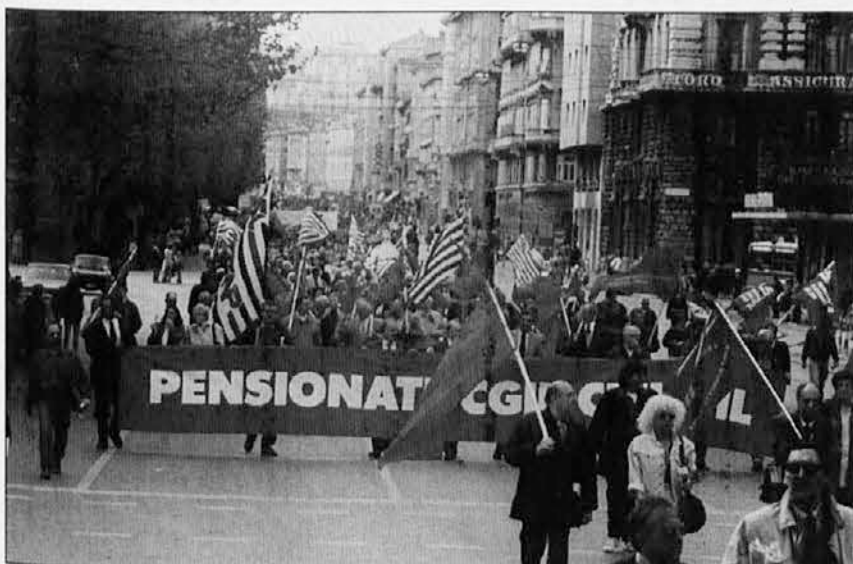
Ob letošnjem 1. maju - prazniku dela je bila glavna manifestacija v Brindisiju. Fotografija prikazuje tržaški sprevod. Vsi govorniki so poudarjali predvsem veliko pomankanje novih delovnih mest in naraščajočo brezposlenost