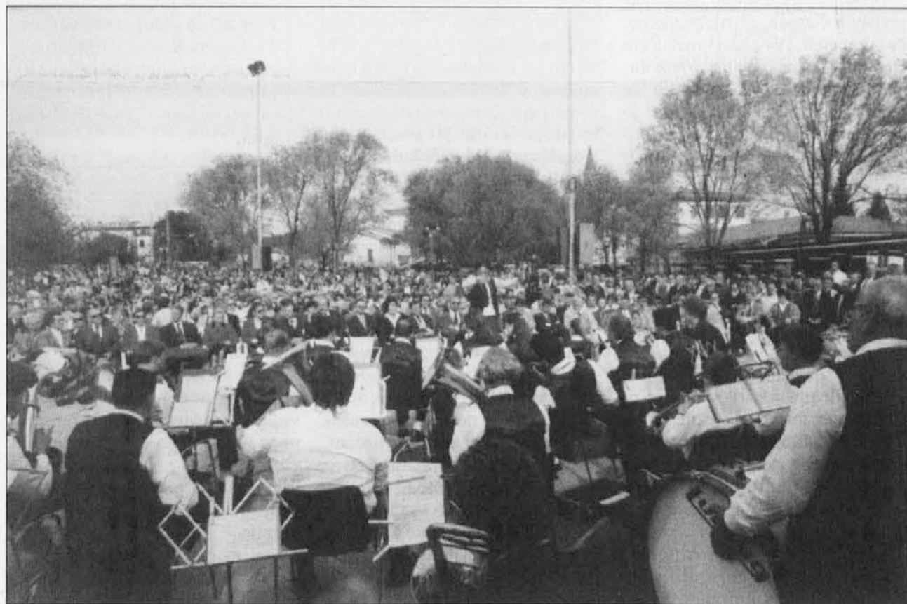
Pogled na veliko množico ljudi v Doberdolu

Prisotne v Doberdolu je pozdravil tudi predsednik slovenskega parlamenta Jožef Školč. Pozitivno je ocenil nastanek slovenske države in izrazil zaupanje v boljšo prihodnost. Pred začetkom slavja so prebrali tudi telegram slovenskega pre-