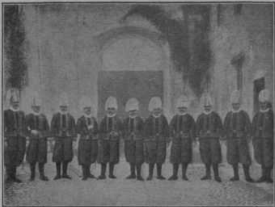
Skupina vojakov iz palatinske garde.

Papeževa vojska. Že od nekdaj, posebno še ko so imeli veliko samostojno državo, so imeli rimski papeži svoje vojake. Ti vojaki so imeli predvsem dolžnost skrbeti za varnost v papeževi državi, braniti potnike pred roparji itd., le malokdaj so branili državo kot tako. Danes so v vatikanski državi le še te vrste vojaštva: plemiška, švicarska in palatinska garda in pa žandarji. — Uniforme vseh so zelo pisane in slikovite in med seboj niti najmanj slične. — Najuglednejša je plemiška garda. Vsak, ki vstopi v plemiško gardo,