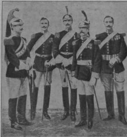
Skupina iz plemiške garde.

postane takoj kapetan. Vojaki plemiške garde so sinovi plemiških rodbin iz nekdanje papeževe države. Biti morajo vsaj 1.72 m visoki in lepega, izbranega vedenja. Za časa papeževanja Leona XIII. se niso smeli družiti z italijanskimi oficirji, niti hoditi na lov z italijanskimi plemiči. Zabranjeno jim je bilo tudi prisostvovati svečanim sprejemom, godbam in plesom. — Plemiška garda je papeževa osebna straža; ustanovljena je bila l. 1485. pod papežem Inocencem VIII. Nekoliko pozneje je papež Pij IV. uredil posebno gardo 100 plemičev, ki jih je plačevala rimska občina in jih dodelila papežu kot dar; dobila je ime »Cavallieri della Fede« (plemiči vere). Stanovali so v Vatikanu in so bili črno oblečeni. Papež Pij VII. je l. 1801. spremenil to gardo v »Guardia Nobile Pontificia« (papeževa plemiška garda) in Leon XIII. jo je organiziral, kakor je danes. — Švicarska garda je bila ustanovljena l. 1505. za časa papeža Julija II. Ta se je dogovoril s kantonoma Curih in Lucern v Švici, da mu oskrbita 250