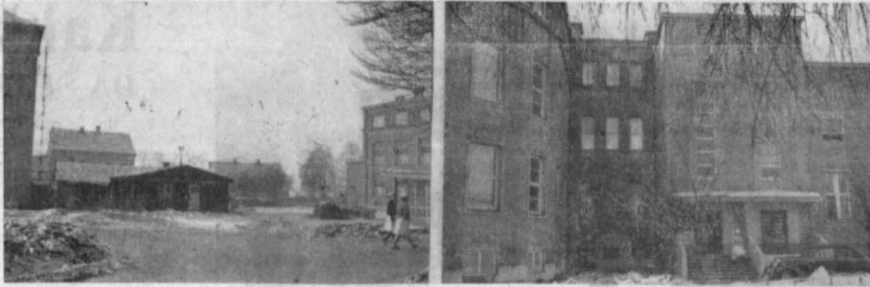
Del kirurškega oddelka, kjer bodo postavili prizidek, v neposredni bližini ginekologije (levo).

Toda to so za zdaj le še »megleni horizonti«, ker za uresničitev zamisli ni finančnih sredstev; perspektivni