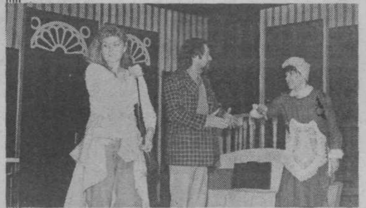
Na sliki je prizor iz komedije HRUP ZA ODRUM, ki jo bo 21. februarja uprizorilo Primorsko dramsko gledališče iz Nove Gorice

V mesecu februarju bo zveza kulturnih organizacij Lj. Moste-Polje pripravila še dva posveta, oba v prostorih kulturnega doma Španski borci, in sicer v ponedeljek, 18. februarja ob 13. uri posvet s predsedniki kulturno-umetniških društev in skupin ter ob 18. uri posvet z mentorji plesnih skupin.