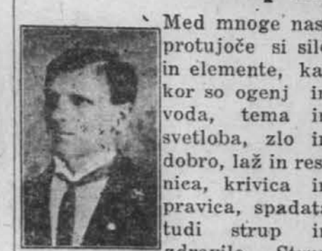
AND. TOMEC, povzroča bolečih po poklicu prene, bolezni in smrti in vsem najpogumnejši in najbolj boriteljev za našo stvar, katol. stvar.

Med mnoge nasprotniče si sile in elemente, kakor so ogenj in voda, tema in svetloba, zlo in dobro, laž in resnica, krivica in pravica, spadata tudi strup in zdravilo. Strup po poklicu prene, bolezni in smrti in vsem najpogumnejši in najbolj boriteljev za našo stvar, katol. stvar.