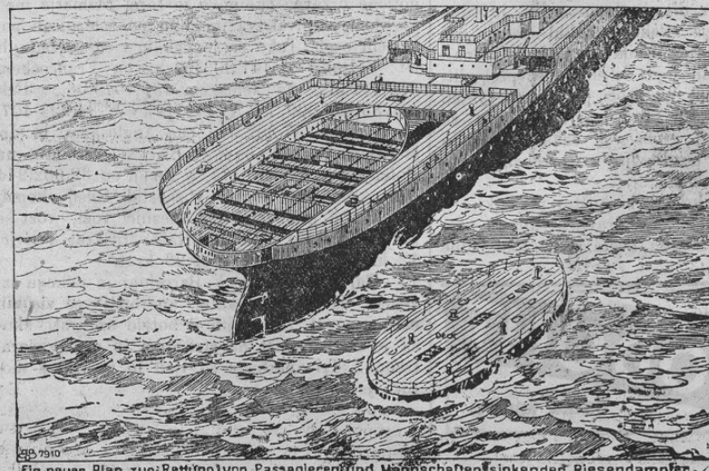
Ein neuer Plan zur Rettung von Passagieren und Mannschaften sinkender Riesendampfer.

Potop parnika „Titanic“ je dokazal, da je imel parnik premalo in preslabih rešilnih čolnov. Naša slika kaže zdaj novo rešilno sredstvo, ki je bilo ravnokar iznajdeno. Po tem načrtu bi obstal zadnji krov parnika iz velikega samostojnega „flosa.“ V slučaju potopa podali bi se potniki na ta „flos“ in bi se na ta način rešili. Na „flosu“ so motorji, ki bi „flos“ tudi lahko gibali. Velike par-