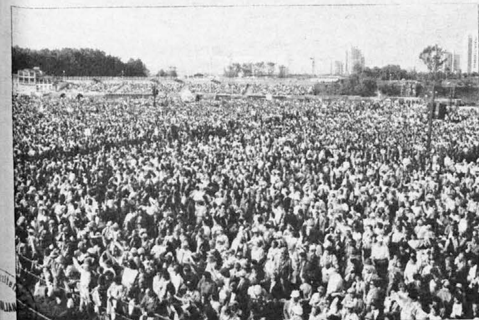
Množica Slovencev na hipodromu v Ljubljani med papeževim mašo.