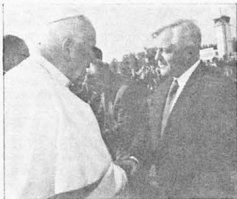
Janez Pavel II. in predsednik Kučan.

Papež Janez Pavel II. se je po slovesu od Brezije odpeljal proti rezidenci Grad Brdo, kjer ga je pred vhodom pričakoval, pozdravil in sprejel predsednik Republike Slovenije Milan Kučan. Sprejemu pred rezidenco sta sledila zasebno srečanje in pogovor med gostiteljem in gostom.