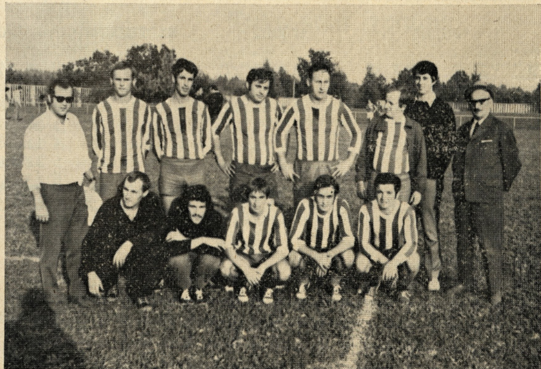
Naša zmagovita nogometna ekipa z vodstvom. Več o tem preberite na 4. strani