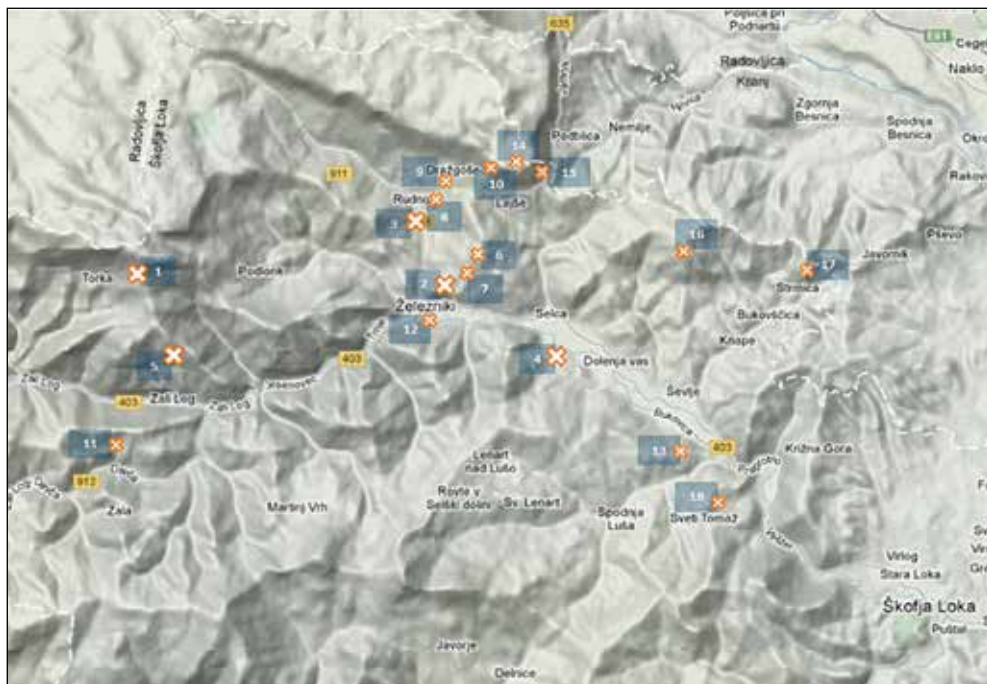
Tlorisni prikaz raziskanih in domnevnih arheoloških najdišč v Selški dolini, po predlogi Google maps Miha Markelj, 2013.

Kljub najstarejšim najdbam lahko iz slike arheoloških najdišč v Selški dolini ugotovimo, da je največje število najdb in najdišč iz starejše železne oziroma halštatske dobe. Iz omenjenega časa ima