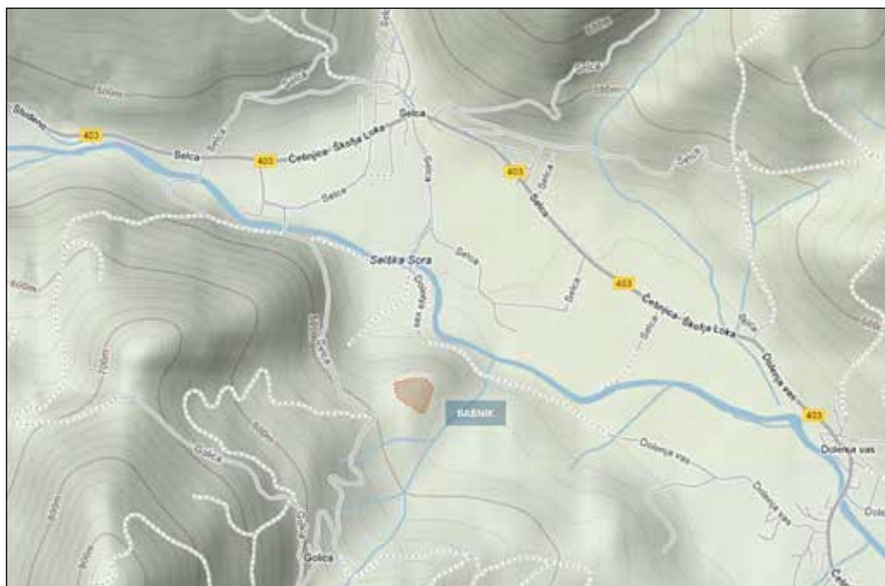
Tlorisni prikaz in obseg najdišča Babnik nad Selci, po predlogi Google maps Miha Markelj, 2013.

dobo. V tem kontekstu je zanimiva tudi primerjava najdišča s tistim iz Puštala nad Trnjem, saj po mnenju arheologov gre za sorodno najdišče.