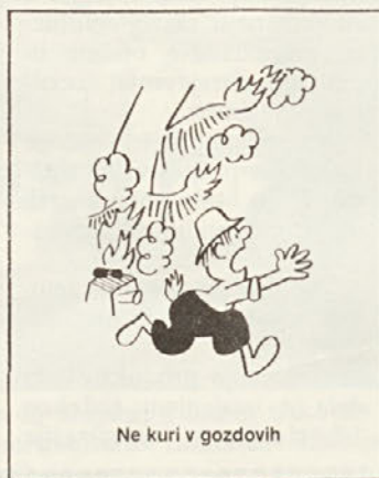
Ne kuri v gozdovih

Dejstvo, da sedaj dve leti ni bilo veliko gozdnih požarov, nas ne sme uspavati. Ob suhem, sončnem, vetrovnem in razmeroma toplem vremenu se namreč nevarnost požarov izredno hitro stopnjuje. Pripraviti pa se moramo tako temeljito, da bomo obvarovali gozdove tudi ob takih izrednih razmerah.