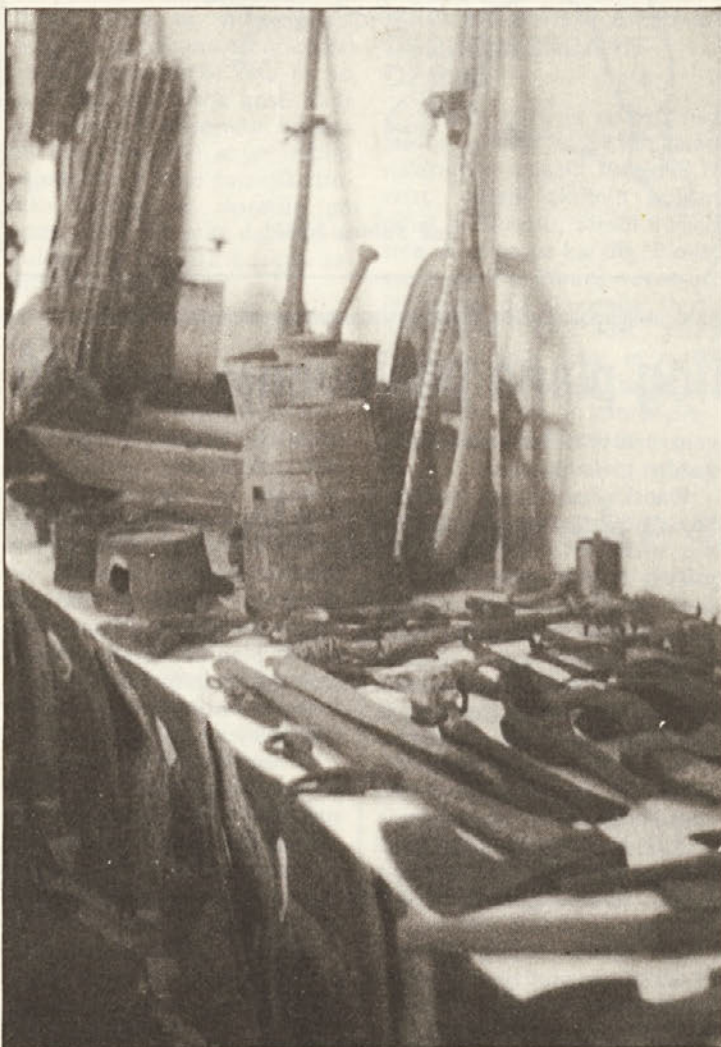
Pogled na razstavljeno kmečko in gozdarsko orodje na razstavi Gozd, gobe, cvetje – septembra letos. Orodje je zbral tov.Serini.

Glasilo izdaja delavski svet gozdnega gospodarstva Novo mesto – Odgovorni urednik ing. Janez Penca. Uredniški odbor: Franc Markovič, ing. Jože Falkner, ing. Jernej Piškur, ing. Slavko Klančičar, Janez Šebenič, ing. Tone Šepec, ing. Jože Vidervol in ing. Tone Hočevnar – Izhaja enkrat na mesec v 2000 izvodih. – Uredništvo: Novo mesto, Gubčeva 15 – Časopisni stavek, filmi in prelom: ČZP Dolenjski list Novo mesto – Tisk: Knjigotisk Novo mesto – Na osnovi ustreznega dokumenta prosto plačila prometnega davka.