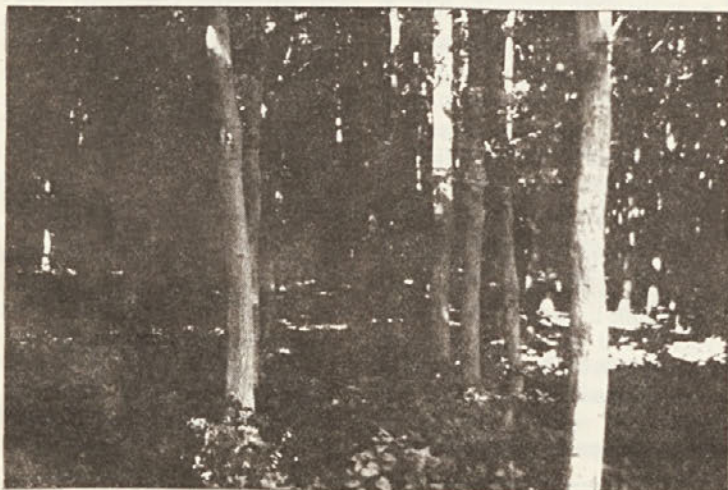
Za nas nenavadno: v vrste sajena bukev.