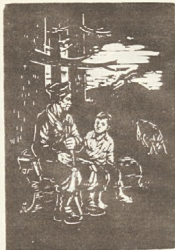
Ive Šubic: Razgovor

8. Skrbeli bomo za zimsko vzdrževalna in preventivna dela (odmetavanje snega s streh vseh stavb).