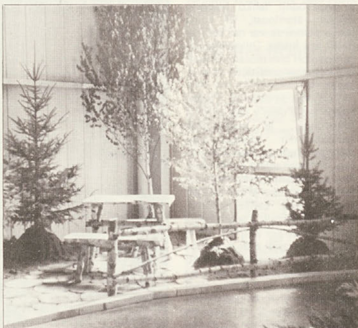
Kotiček na vrtu z brezovo mizo in klopmi, z lesom tlakovan in ograjen z brezovimi oblicami (hortikulturna razstava v Ljubljani septembra 1978).

V gozdovih Turčije je največ borov, bukve in jelke. Pogozdujejo pa sedaj na enem področju s pinus brutia (70%), pinus maritima (20%) in pinus nigra (10%), na drugem pa s pseudotsugo taxifolio (30%), pinus nigra 50% in z drugimi bori 20%. V višjih legah pogozdujejo pinus contorta. V nižjih legah do 500 m n. v. kot topola hitro raste pinus radiata, ki pa ima velikega sovražnika v Evetria buoliana (borov zavijač).