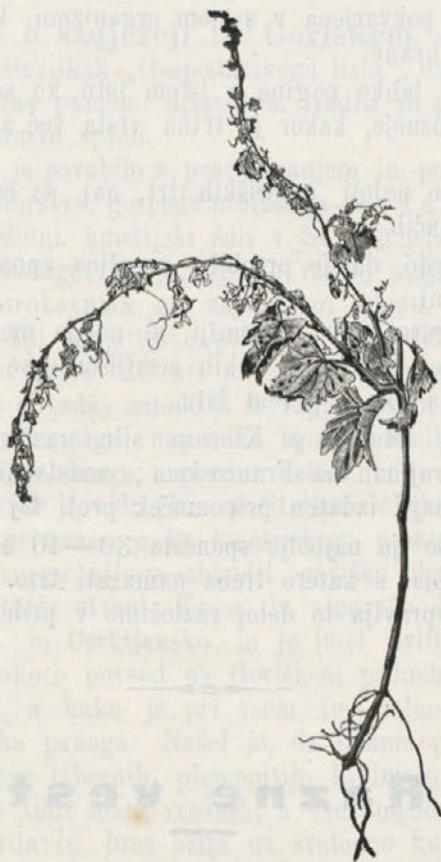
Mlada dvoletna trta iz Castelvechio, napadena po Klorosi.

O tej prikazni nismo nameravali govoriti, pač pa o pravi klorozi, katero poznajo na Francoskem tudi pod imenom Cottis. Na bolni trti pobledi listje že pomladi, potem postaja ramenikasto