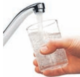
Poslanci so dosegli potrebno dvotretjinsko večino za vpis pravice do pitne vode v ustavo.

Vlada je sprejela izhodišča za pogajanja z javnim sektorjem, vrh koalicije pa se uskladi tudi o zakonskih predlogih za izvedbo davčnega prestrukturiranja, ki gredo v javno obravnavo.