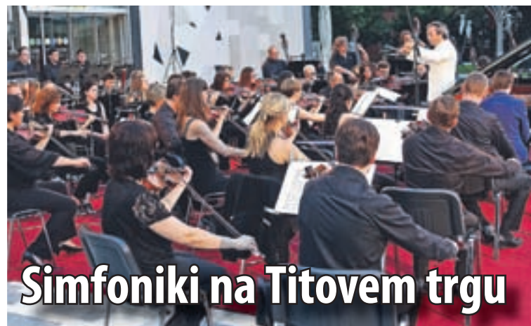
Simfoniki na Titovem trgu