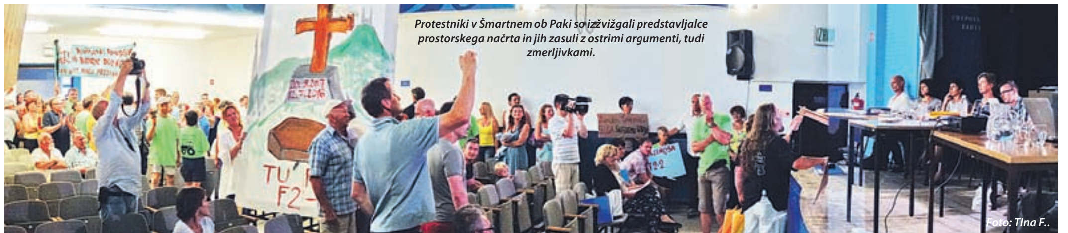
Protestniki v Šmartnem ob Paki so izžvižgali predstavnike prostorskega načrta in jih zasuli z ostrimi argumenti, tudi zmerljivkami.