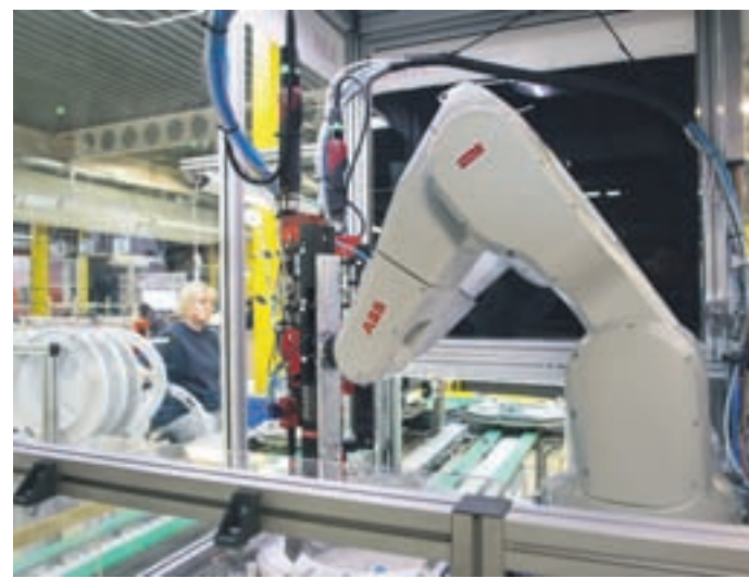
Njihova proizvodnja je visokotehnoška, delovna mesta pa prilagojena invalidom.

V bistvu so uporabniki državnih pomoči. V praksi je videti to tako, da so oproščeni plačil v zdravstveno in pokojninsko blagajno. Ta tako imenovana odstopna sredstva pa lahko kot državno pomoč porabijo delno