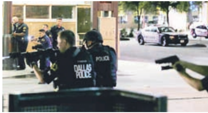
Protestnik je pet policistov ubil in jih sedem ranil.

Članice in zaveznice zveze Nato so na vrhu v Varšavi sprejele zgodovinsko odločitev: v Estonijo, Latvijo, Litvo in na Poljsko bodo naslednje leto napotile okoli 4000 vojakov.