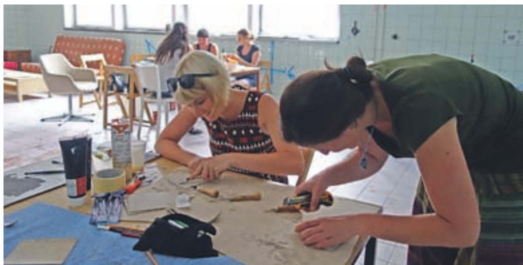
Na delavnicah Na stežaj so izdelovali lampione, tiskali grafike, po azijsko vezali skicirke in ustvarjali v glini.

Pred petimi leti so mladi šaleški likovniki dobili idejo, da zapuščeno pekarno v Starem Velenju preuredijo v prostor za ustvarjanje in razstavljanje ter druženje in izobraževanje mladih ustvarjalcev, ki se soočajo s prostorsko stisko tako pri nastajanju kot razstavljanju del. Pobudo za obuditev industrijske gmote v starem mestnem jedru so pozdravili Mestna občina Velenje, ki je poskrbela za luč in vodo, Krajevna skupnost Staro Velenje, ki je sprejela mlade likovnike, Mladinski center Velenje pa je podprl izvedbo. S kolegi iz cele Slovenije so pospravili navlako in pripravili prvo razstavo na temo kruha, ki je v Pekarni gostovala med 15. Festivalom mladih kultur Kunigunda. Takrat ustanovljeno društvo Koncentrat je prevzelo skrb za program, sode-