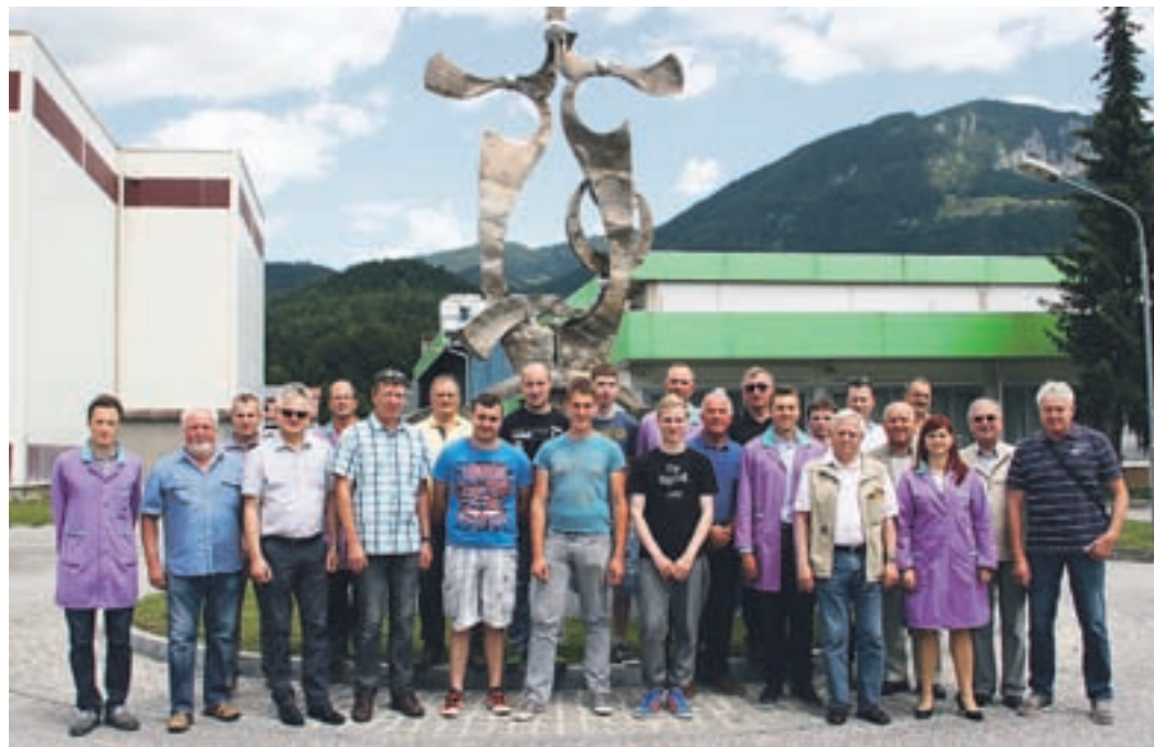
Člani SDV in študentje elektronike ŠCV skupaj z vodniki pred simbolom porekla in kakovosti firme KLS na Ljubnem ob Savinji.