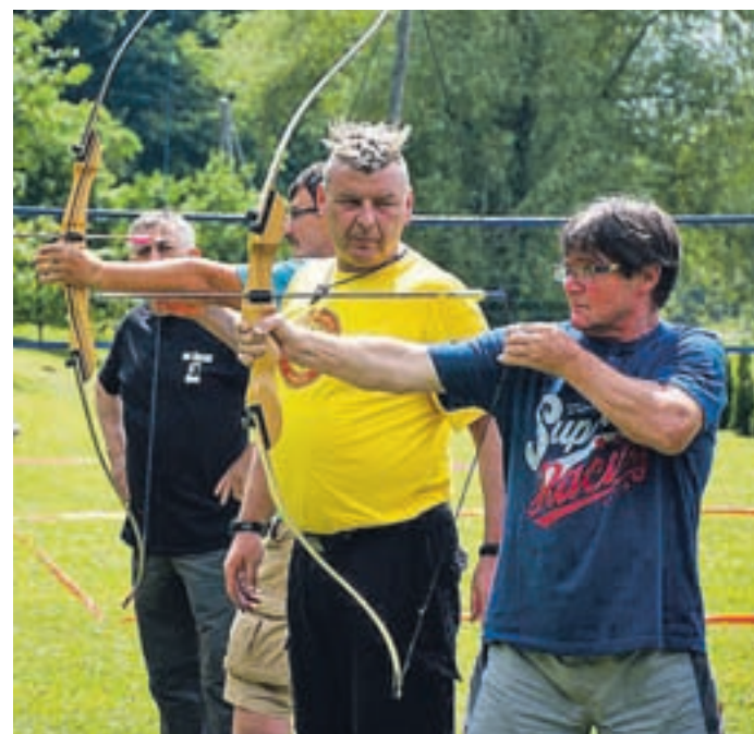
V šaljivih igrah se je pomerilo pet ekip. Uživali so tako tekmovalci kot gledalci.