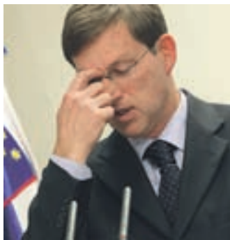
Podmladek SD je razjezil premierja.

Pred sejo vlade je potekal koalicijski sestanek, ki pa se je končal nenavadno hitro – podmladek stranke SD je namreč podprl