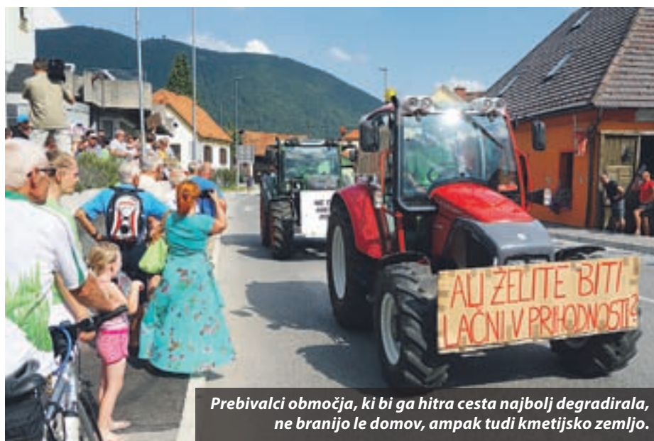
Prebivalci območja, ki bi ga hitra cesta najbolj degradirala, ne branijo le domov, ampak tudi kmetijsko zemljo.

Najglasnejši na protestu so bili Podgorani, ki so tudi najdlje vztrajali, podpore pa so imeli veliko. »Ker gre cesta čez našo domačijo in ker se s takim razmetavanjem davkoplačevalskega denarja ne strinjamo,« je povedal eden izmed njih, drugi so ga dopolnjevali: »Ker je to finančno najslabša trasa, ki ogrozi preveč domov in ljudi, kmetijske zemlje, vodnih virov. Slovenska mafija to izsiljuje in hoče uničiti cel kraj in pol šmarške občine, da ne govorimo o Braslovčah in Polzeli. V Sloveniji smo na kratkem s kmetijsko zemljo in še to nam hočejo vzeti. Proti temu se bomo borili tudi z državljansko nepokorščino, če bo potrebno.« Predlagajo pa traso Arja vas-Velenje, ker je že bila načrtovana in je izvoz že narejen, ker ne bo porušila toliko hiš in je cenejša, so naštevali argumente. »Razmislite o alternativni, ker mi te zemlje ne bomo dali in ta cesta ne bo šla čez našo dolino. Obrnite se k boljšim rešitvam, ki obstajajo,« pa je njihovo sporočilo predstavnikom ministrstev, projektantom, tudi 'velenjskemu ljubju'.