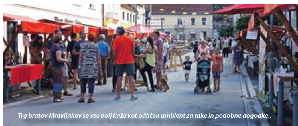
Trg bratov Mravljakov se vse bolj kaže kot odličen ambient za take in podobne dogodke..

Organizacija takega dogodka terja veliko dela. »A če imaš okoli sebe ekipo in podporo Občine Šoštanj in Krajevne skupnosti Šoštanj, tako kot smo ga imeli mi, ter starejših, ki imajo s tem nekaj izkušenj, potem gre. Vsak naredi svoje. Mi mlajši pa smo sorazmerno s popuščanjem vročine in bledenjem dneva. Bolj je