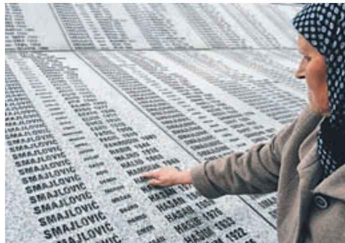
Žrtev iz Srebrenice nikoli ne smemo pozabiti.

Premier se je odzval na očitke o privatizaciji. »Na družbo za