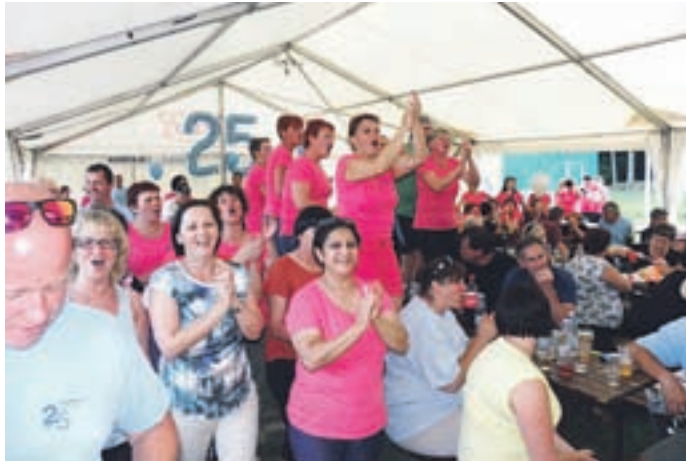
Delavci IPC so pripadni svojemu kolektivu, s ponosom so tudi praznovali.

Tako kot se je širila proizvodnja, je rastle tudi število zaposlenih. Največ so jih imeli leta 2009, kar okoli 900. »Iz peščice ljudi, ki so orali ledino, je zrastle danes največje invalidsko podjetje v Sloveniji. Trenutno zaposluje 844 delavcev, imamo trden in uspešen proizvodni prog-