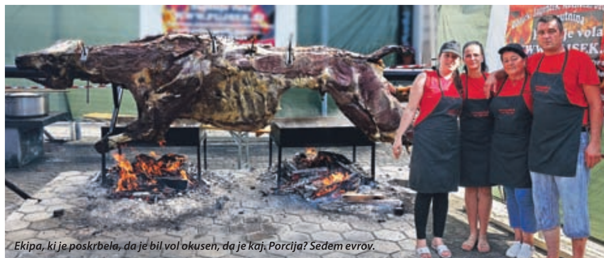
Ekipa, ki je poskrbela, da je bil vol okusen, da je kaj. Porcija? Sedem evrov.

Res so zmagali. Z volom, vinom, z vsem, kar so v soboto pripravili na trgu.