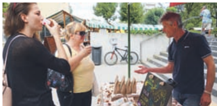
Šaleške ekološke pridelovalce in predelovalce sta zastopali kmetija Eko Mlinar in Pražarna Lovro.