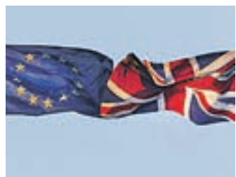
Britanci so zavrnilo izvedbo šene referenduma o odhodu iz EU.

Britanska vlada je zavrnila peticijo za ponovno izvedbo referenduma o članstvu Velike Britanije