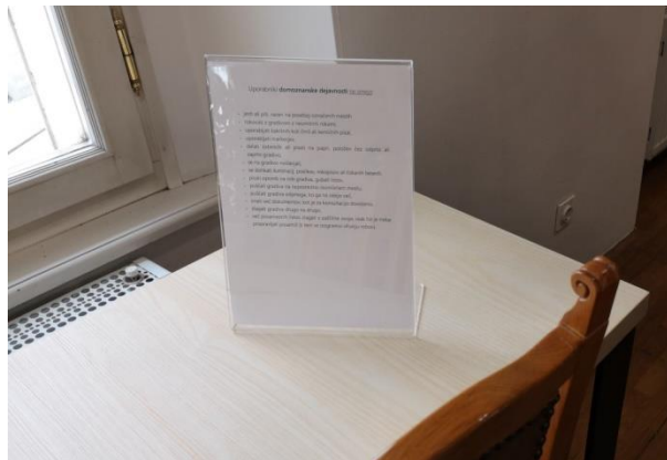
Slika 3: Navodila uporabnikom čitalnice domoznanske dejavnosti

Nove knjižne police, ki so namenjene domoznanski zbirki, so načrtovane v skladu z načeli. Gradivo, ki je postavljeno na nove knjižnične police, je postavljeno na podlagi pravil. Zbirke pomembnih osebnosti so zložene po velikosti, saj veliki formati poleg majhnih niso dovolj podprti. Velike, težke in strukturno šibke knjige, ki so shranjene v vitrini, hranimo vodoravno, da jim nudimo vso oporo, ki jo zahtevajo. Gradivo je obrnjeno tako, da je mogoče videti naslove. Pri temu je bilo potrebno paziti, da gradivo ne sega čez police (IFLA ..., 2000, str. 68–69). Gradivo je razvrščeno po abecedi. Z namenom varovanja domoznanskega gradiva so na mizi, ki je namenjena pregledovanju gradiva, postavljena navodila uporabnikom, kot jih predpisujejo načela (IFLA ..., 2000, str. 65).