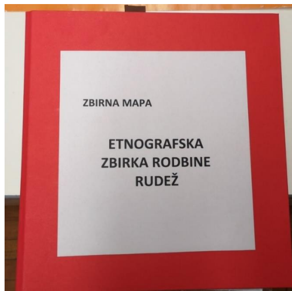
Slika 1: Primer zbirne mape

Eden od načinov izgradnje zbirke je tudi kreiranje zbirnih map. Knjižnica je v preteklosti že izdelala dve zbirni mapi, ki sta bili narejeni po vzoru Valvasorjeve knjižnice Krško. Za nadaljevanje te dejavnosti je treba opredeliti vrsto podatkovne zbirke, kar predstavlja zbirna mapa. Podatkovne zbirke lahko opisujemo in obravnavamo glede na različne kriterije. Glede na to, kakšne vrste so podatki, delimo zbirke v besedilne, numerične, zvočne, slikovne in večvrstne. Zbirne mape bi lahko uvrstili med tematske bibliografske zbirke, ki pokrivajo neko tematsko področje. V njih so shranjeni bibliografski zapisi, ki so po svoji strukturi podobni zapisom v knjižničnem katalogu (Žumer, M., 2004, str. 105, 108). Za to dejavnost bi bilo priporočljivo določiti standardiziran način urejanja zbirne mape. Za te potrebe smo izdelali primer bibliografskega kazala zbirne mape, ki je priložen v prilogi (Priloga 1). Proces nastajanja zbirne mape je podoben procesu nastajanja bibliografije, ki ima naslednje faze: zbiranje in izbiranje gradiva, bibliografsko opisovanje in klasificiranje ter urejanje bibliografskih zapisov (Žumer, F., 2004, str. 129). Trenutna zasnova zbirnih map omogoča iskanje gradiva po bibliografskih podatkih, ki so v posameznih sklopih označeni s številkami. Številke si sledijo v enakem vrstnem redu, kot je označeno gradivo v mapi. Zaradi možnosti poškodbe ali izgube gradiva smo izdelali tudi duplikat mape.