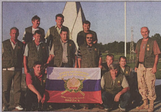
Udeleženci srečanja, pripadniki 174. PdivVTO Brežice '91, pred spominskim obeležjem v Krakovskem gozdu

Zaloke, Mostec - Ob 15. obletnici osamosvojitvene vojne so se že na tradicionalnem letnem srečanju zbrali pripadniki 174. protidiverzantskega voda Teritorialne obrambe Brežice 1991. Enota brežiških protidiverzantov je edina v Sloveniji, ki se redno srečuje vsako leto drugo soboto v mesecu septembru od leta 1991. V dosedanjih petnajstih srečanjih so pripadniki enote priložnostno obiskali vsa bojišča v Posavju, se poklonili spominu padlim za domovino, si ogledali muzejske zbirke iz osamosvojitvene vojne '91, sodelovali na srečanjih veteranov ter predvsem aktivno izkoristili skupno druženje za športne aktivnosti, izmenjava mnenj, izkušenj in spominov.