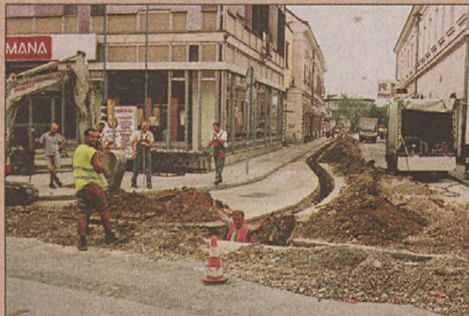
Uspešna plinifikacija Brežic