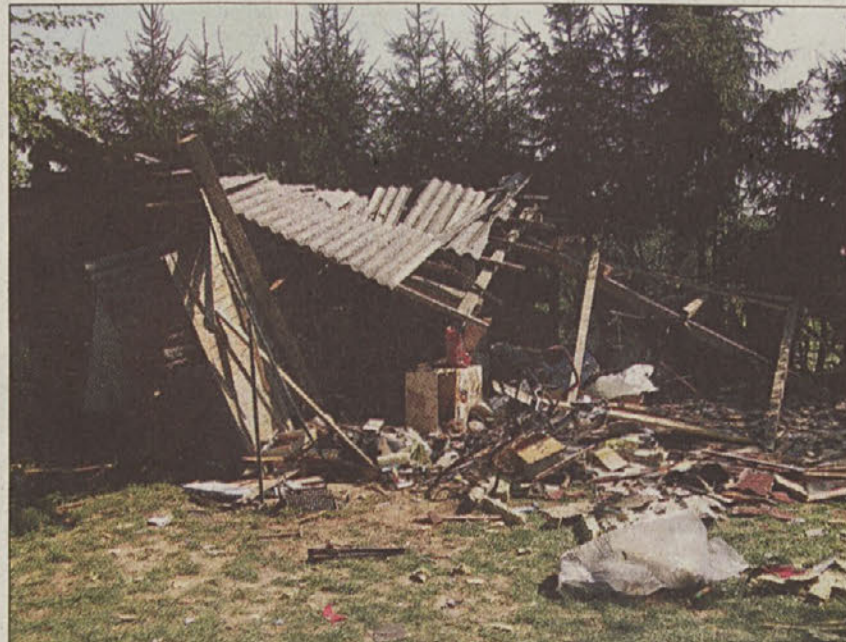
Ostanki lesene lope

Gospodarsko poslopje, narejeno iz lesa in izolacijskih plošč, je bilo ob eksploziji v celoti uničeno. Med ogledom kraja dogodka je bilo v objektu in v osebnem vozilu pokojnega najdenih še več kosov različnih eksplozivnih naprav in nabojev, katerih izvor pa še ni ugotovljen. Ker je očitno, da je v danem primeru šlo za nesrečen slučaj in je tuja krivda izključena, bo na okrožno državno tožilstvo podano le poročilo. N.Č.C.