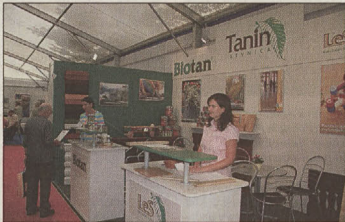
Sevniški Tanin je vzbujal pozornost obiskovalcev s svojimi premazi za les in sredstvi za zatiranje lesnih insektov.

Svoj paviljon je postavila tudi krška zbornica, ločeno pa so se predstavili tudi znani krški obrtniki. N.Č.C./ V.P.