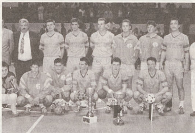
...in z ekipo celjskih državnih prvakov le nekaj let pozneje...

Počasi bo treba zlagati na kup in misliti na prihodnost, vendar imam vsaj še štiri leta časa, da se s tem ne obremenjujem in da dam na igrišču vse od sebe ne glede na finačno plat igranja. V 26., 27. letu pa se profesionalni rokometišči začnejo ozirati po tem, kako bi svoje rezultate čim bolj iztržili in tu sama kvaliteta igre ni več na prvem mestu.