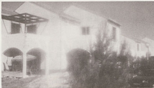
Turistično naselje Loparji na Lošinju, v katerem imajo svoje počitniške kapacitete tudi kočevska podjetja.

V času med 20. in 25. junijem, sva avtorja prispevka kot zunanja gosta "otvorila" sezono v Melaminovem apartmaju v Loparjih na Lošinju, zato nekaj vtisov in napotkov iz prve roke: Za 1 kuno je bilo treba odšteti 22 tolarjev, pri čemer vas bo voznja z avtomobilom za 4 osebe na Lošinj preko Krka s trajektom na Cres vključno z mostnino stala 100 kun. Hrana in pijača, vključno z mlekom, je na hrvaškem vsaj 30 %, (posamezni artikli pa tudi za 50%) dražja od naše (pivo Union v trgovini stane skoraj 6 kun). V turističnih naseljih prevladujejo Slovenci in Čehi, hrvaško osebje v recepciji, trgovini in drugih lokalih je bilo prijazno nad vsemi pričakovanji. Aparmaji so dobro opremljeni, odsotnost množičnega turizma v zadnjih letih se pozna predvsem na manj urejeni okolici z nedokončanimi investicijami. Slovensko dnevno časopisje je skoraj v vsaki trgovini. Nasvet: