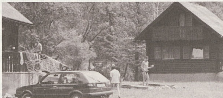
Dol - eden redkih pravih turističnih krajev z avtokampom na Kočevskem.