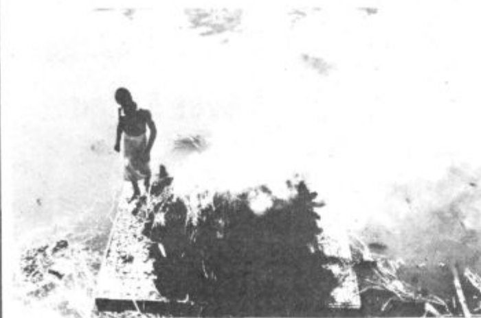
Hindujski pogreb pod Kilimandžarom