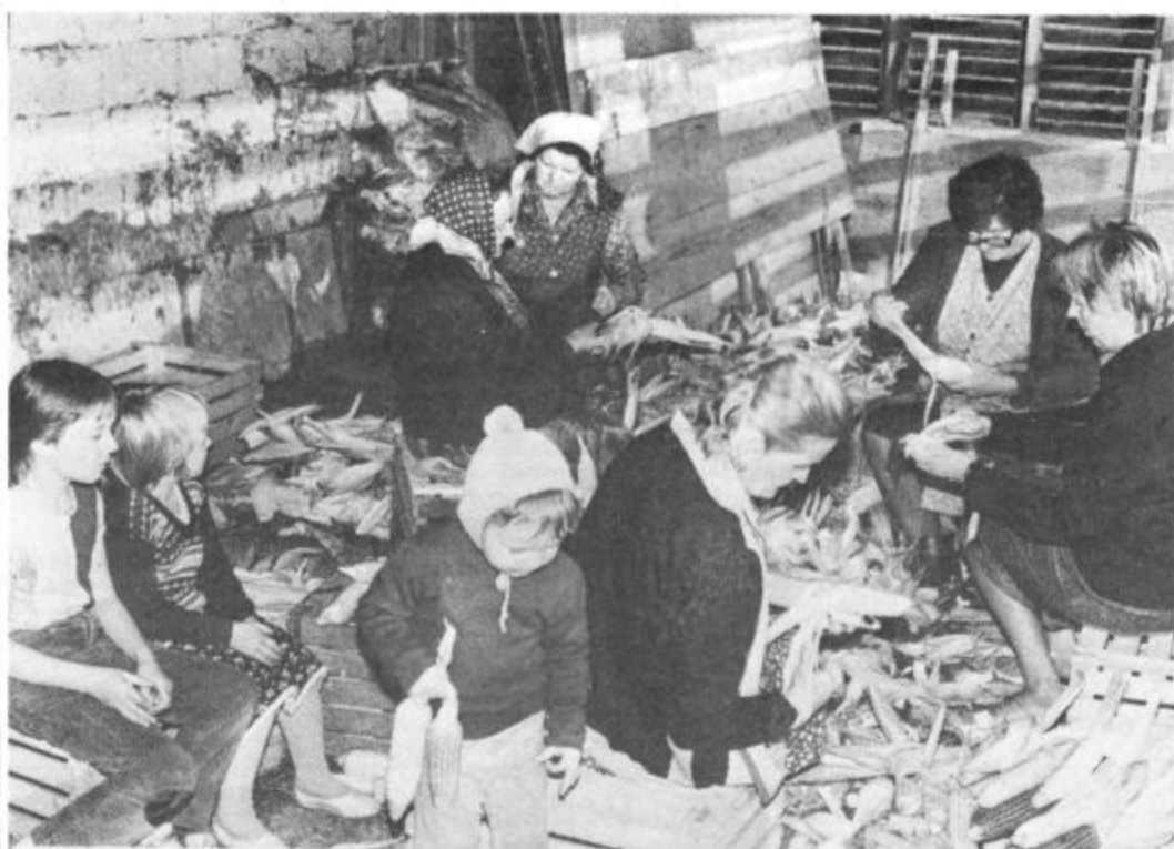
Poletje se je poslovilo, nastopila je bogata jesen s svojimi plodovi in obilico dela za pridne roke. Več se jih zbere ob ličkanju koruze, prijetneje je.