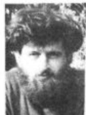
Piše: Vane Gošnik

Vest o petih ugodnih lokacijah za odlaganje radioaktivnih smeti (od koder sta očitno najprimernejši dve v naši neposredni bližini) je bila zame pričakovana. Tudi dejstvo, da jih je neposredno izbrala nuklearka sama (ki za to niti približno ni poklicana), me ni presenetilo. Še manj sem bil razburjen zaradi dejstva, da kriteriji za izbiro primernih lokacij sploh še niso iz-