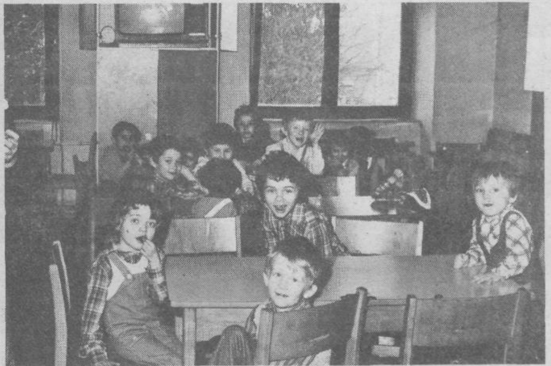
Zavod za srčne rekonvalescente dr. Marko Gerbec, Šentvid pri Stični

V krajšem srečanju so otroci povedali, da se ukvarjajo v prostem času z različnimi aktivnostmi. Nekajkrat letno izide glasilo „Naš prijatelj“ v okviru literarnega krožka, v dramskem krožku pripravljajo proslave in sodelujejo z osnovno šolo „Ferdo Vesel“, lutkovni krožek je pripravil prireditev, v okviru krožka OZN tekmujejo v kvi-