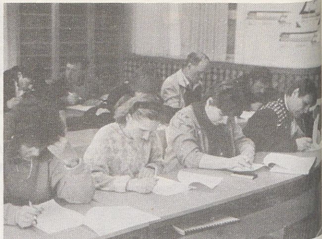
Preizkus znanja o upravljanju PUR naprav